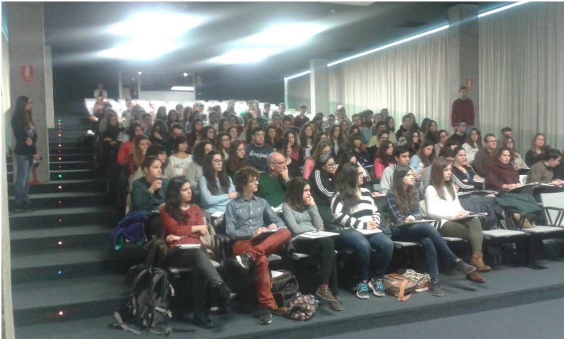
Figura 2. Fotografía de los asistentes durante un turno de preguntas.

El número de matriculados en el curso ascendió a 120 alumnos (figura 2), 7 de los cuales no pagaron matrícula, al tratarse de colaboradores, necesarios para la buena ejecución del curso, el desarrollo de las diferentes sesiones, la moderación de los turnos de preguntas, el control de la asistencia, etc. De esta manera, el número de matrículas remuneradas ascendió a 113, con un precio de 70 € cada una, lo que reportó una recaudación total de 7.910 €. De esta cantidad, la Universidad de Salamanca recibió 1.582 € (el 20%). El remanente, junto con la dotación económica recibida mediante este proyecto (500 €) se utilizó para el pago de carpetas, charlas, desplazamientos, alojamiento, cartelería, un pequeño detalle corporativo para los ponentes de fuera de la Universidad de Salamanca y café para el alumnado durante las sesiones de discusión con los ponentes (ver justificación económica anexa).