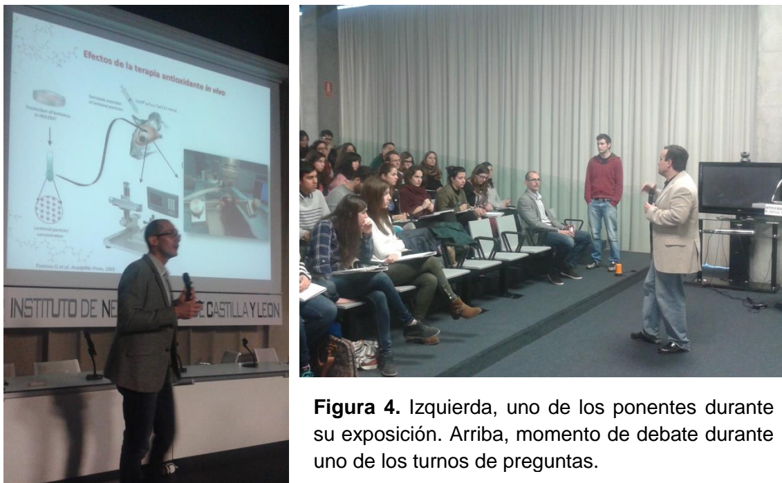
Figura 4. Izquierda, uno de los ponentes durante su exposición. Arriba, momento de debate durante uno de los turnos de preguntas.

neurociencia en general. Más aun, muchos alumnos mostraron también un notable interés por cursar estudios de postgrado relacionados con la neurociencia, y la orientación de su futuro profesional y /o investigador hacia este campo.