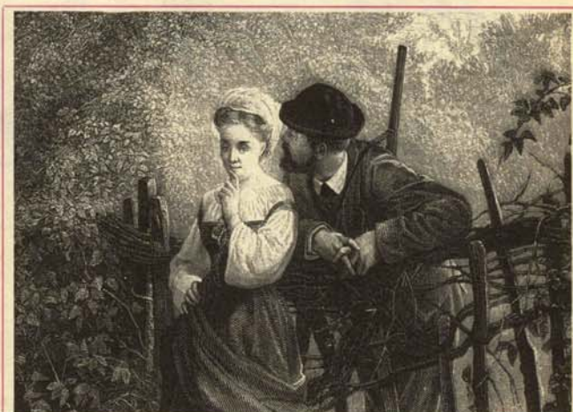
—Si me das un beso, te digo en qué armería he robado el rifle.