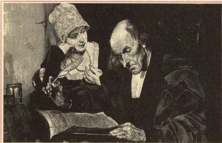
—¡Qué suerte tenemos de que los cuernos no sean signos externos!