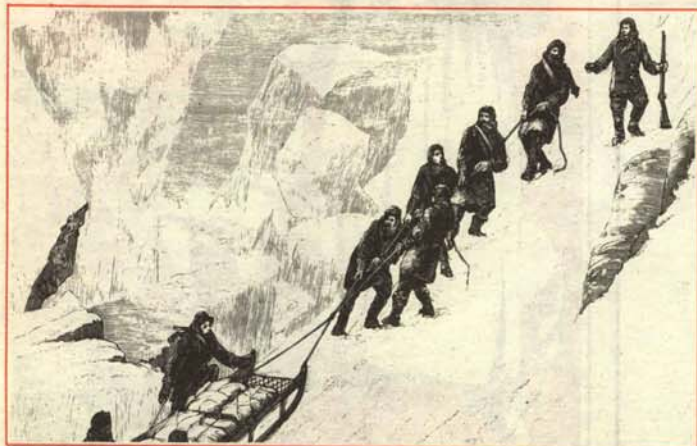
—Cuidado no se nos caiga, que es la contaminación.