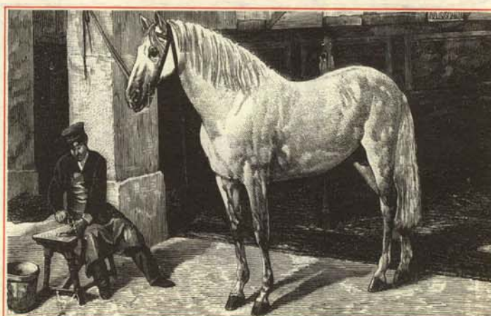
—¿A que no sabes de qué color era el utilitario blanco de Santiago?