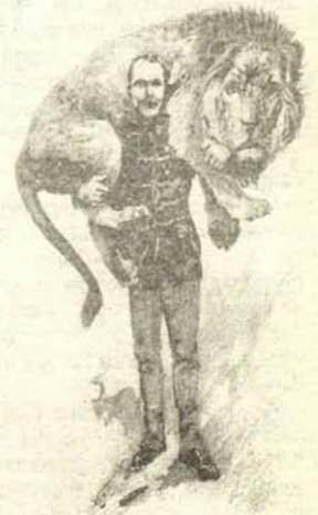
Un ordenanza trasladando a uno de los solicitantes hasta el despacho de inscripción.