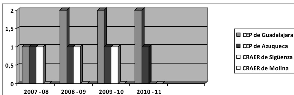
FIGURA 3 Número de cursos ofertados por los CEP de la provincia de Guadalajara relacionados con la Educación Musical en Educación Primaria

En cuanto a los cursos ofertados y relacionados con la Música en Educación Primaria, podemos observar que son muy escasos. Como posible «excusa», hemos de recordar que la especialidad de Educación Musical es impartida por un profesor, teniendo una sola hora lectiva semanal para cada curso, de ahí que con un solo profesor se cubra cada Centro Educativo o más (en el caso de los Centros Rurales