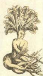
Señor del centro.