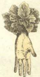
Señor de derechas.