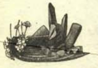
e.—Sombrero que habla como un caballero educado, es decir a gritos. También escupe salvillas.