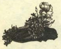
f.—Sombrero que habla con voz atiplada para uso de señoritas que prefieren ser iguales a los caballeros que no lo son demasiado.