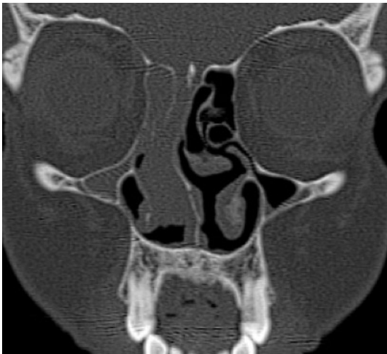
Figura 1. Corte coronal de TAC mostrando lesión polipoide unilateral.

Mujer de 55 años sin antecedentes patológicos, valorada en consulta de Otorrinolaringología por insuficiencia respiratoria nasal de varios meses de evolución de predominio derecho sin otra sintomatología asociada. La endoscopia nasal evidenció poliposis nasal derecha. En la tomografía axial computarizada de senos paranasales (TAC) se confirmó la tumoración polipoide sin signos radiológicos de agresividad, desmineralización del cornete medio derecho y ocupación pansinusal derecha por obstrucción del drenaje (Figura 1).