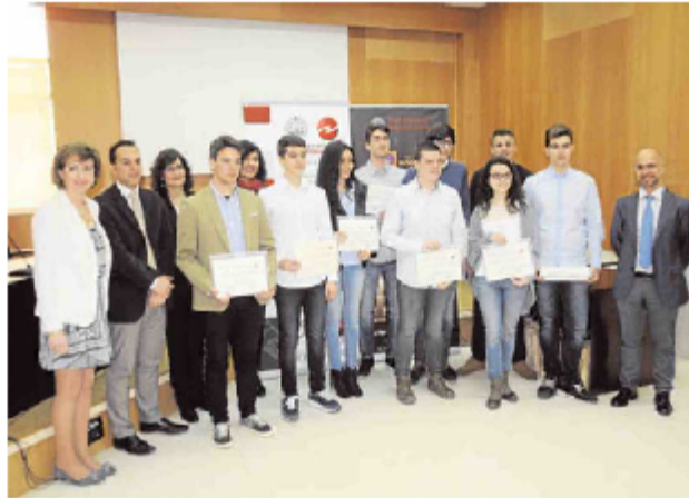
Los premiados en la Olimpiada de Economía con el decano y la vicedecana de la Facultad.