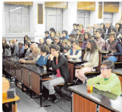
Alumnos y profesores en la clausura de la Olimpiada de Matemáticas.