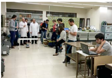
Prueba de velocidad

8) El 26 de mayo de 2016 se celebró el concurso, se presentaron 4 grupos, los grupos participantes realizaron las pruebas establecidas en las bases.