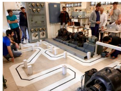
Prueba de maniobrabilidad