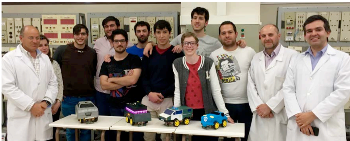
Participantes y jurado del concurso