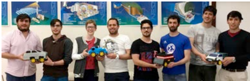
Prueba de estética