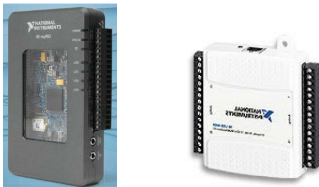
Fig. 1. Dispositivo NI myRIO y NI USB-6008

1.- Los elementos más costosos y fundamentales para la construcción del vehículo son los dispositivos NI myRIO y NI USB-6008 de National Instruments cuyo aspecto se muestra en la figura 1.