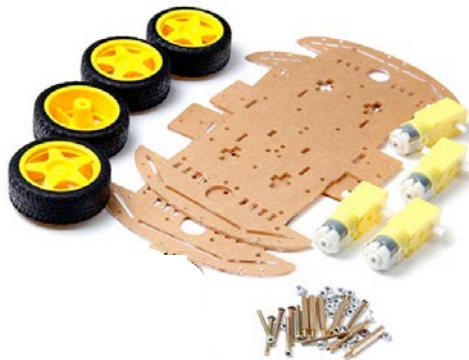
Fig. 2. Elementos de chasis y motores.

2.- Para ayudar a construir el chasis y con el objetivo de unificar las dimensiones y la potencia de los motores del vehículo, se ha facilitado a cada grupo los elementos que se muestran en la figura 2