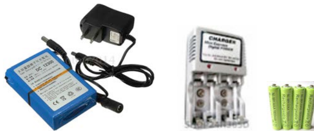
Fig. 4. Baterías recargables y cargadores.

4.- Ha sido imprescindible adquirir también baterías y pilas recargables como las mostradas en la figura 4, para alimentar el myRIO y los motores del vehículo con cargo al presupuesto del Área de Ingeniería Eléctrica.