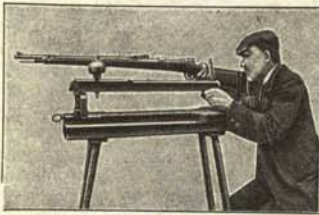
Señor lanzando un rumor.