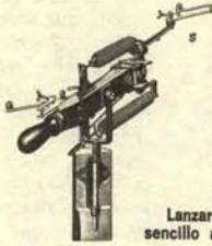
Lanzarrumores sencillo a pedal.

Así es. Ya están en el mercado los nuevos modelos de lanzarrumores automáticos científicamente diseñados.