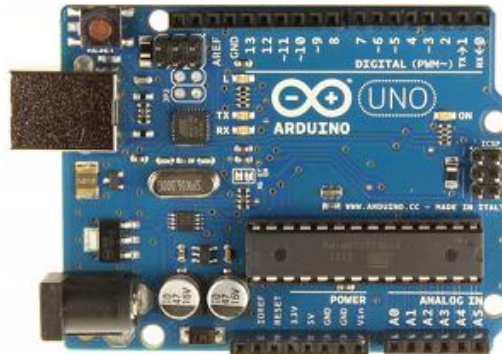
Figura 2: Arduino Uno Rev3