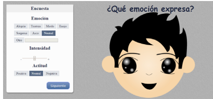
Fig. 5. Interfaz de la encuesta para clasificar las diferentes caras generadas por la combinación de los componentes FAST