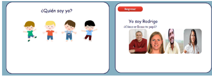
Fig. 2. Interfaz de inicio de los alumnos con TEA, se utilizan las fotografías de los niños; pero por razones de confidencialidad en estas imágenes se utilizan avatares

Para la Enseñanza e identificación de las emociones básicas: Ira, Tristeza, Miedo, Alegría, Amor, Sorpresa, Aversión y Vergüenza se trabaja usualmente por medio de fotografías o pictogramas. En la implementación de esta fase se utilizaron las fotografías validadas de Ekman de estas seis emociones. Para evaluar si el niño es capaz de identificar el conjunto general de elementos, que determinan una emoción en los rostros de las fotografías mostradas, se le hacen preguntas sobre cuál de las dos caras mostradas corresponde a la emoción solicitada, siempre se comparan pares de imágenes. La selección de imágenes a comparar es aleatoria, resolviendo con esto que la dinámica se torne repetitiva y que los alumnos memoricen las respuestas; situación que ocurre con los cuadernillos impresos que los niños con TEA utilizan en sus terapias comúnmente. En la Figura 3. Se presente un ejemplo de cómo se le pide al niño que elija el rostro que corresponde a la emoción solicitada, esto se hace de forma escrita y oral; cuando el alumno responde correctamente se le felicita y en otro caso se le indica que no respondió correctamente y se le invita a tratar de nuevo.