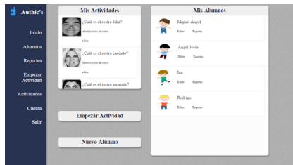
Fig. 1. Interfaz implementada para el terapeuta que le permite registrar nuevas actividades, llevar la historia académica de sus alumnos y generar reportes de avance, las imágenes de sus alumnos se representan con avatares en esta comunicación para guardar la identidad de los niños

El proyecto Authic se implementó en un entorno web (sitio web http://authic.net76.net/ ). Para el desarrollo se utilizó HTML5, JQuery, Ajax, PHP y MySQL. En la interfaz del maestro se optó por una interfaz limpia, sencilla y bien organizada como se muestra en la Figura 1.