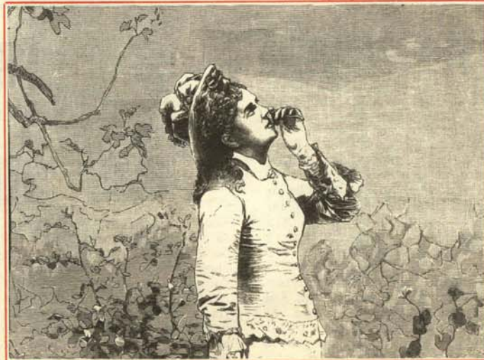
—¡Qué bien huele esta flor! Parece de antes de la guerra.