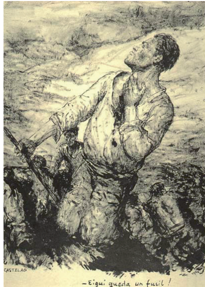
Figura 5: Eiqú queda un fusil! Castelao, Álbumes de guerra. Milicianos . 1938.

Como se verá deseguido esta imaxe pode ser posta en relación con outra das reflexións de Hannah Arendt coma nos anteriores casos.