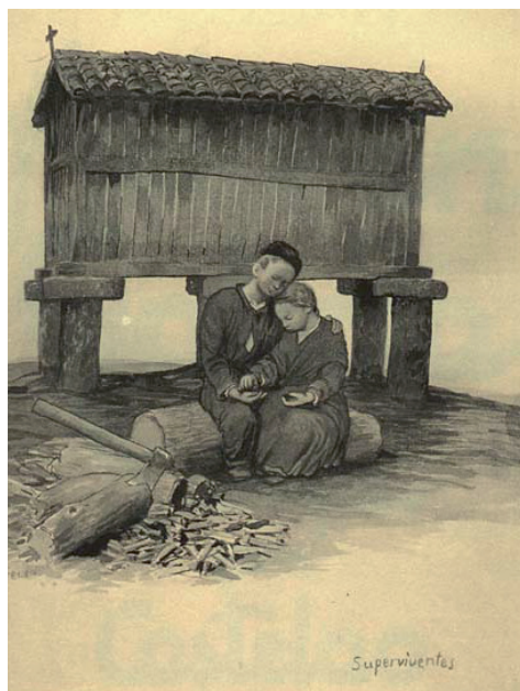
Figura 1: Supervivientes . Castelao, Álbumes de guerra. Galicia Mártir . 1937. Francisco Javier Baltar Tojo é o titular dos dereitos de autor e quen autoriza a solicitude ao Museo de Pontevedra de reprodución das imaxes de Castelao. Como consecuencia da imposibilidade de ter resposta do Sr. Baltar Tojo, tómanse as imaxes do sitio web Castelao na rede < https://castelaonarede.wordpress.com/ >.

extremada. Aquí a brillantez de Castelao reside en amosar a morte sen sequera debuxar unha soa pingueira de sangue; queda reflectida a través da ausencia, porén, tódolos compoñentes da imaxe remiten a esa morte ausente, dende os cativos ata a machada que fica cravada na madeira, probablemente pola man de quen morreu abandonando irremediamente ós seus nenos.