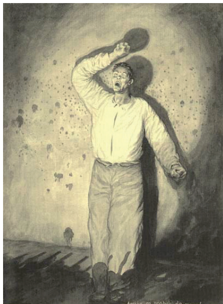
Figura 2: Arriba os pobres do mundo . Castelao, Álbumes de guerra . Galicia Mártir . 1937.

Pódese concluír que a representación en ámbolos dous xéneros resulta moi semellante, tratando de dignificar a figura do aldraxado mediante o seu valor e o xeito de afrontar a execución. Castelao emprega a figura do fusilado pra simbolizar un colectivo, unha sociedade, que loita contra a inxustiza dos fusilamentos; este colectivo ademais será a base social máis desamparada, principais vítimas do conflito bélico.