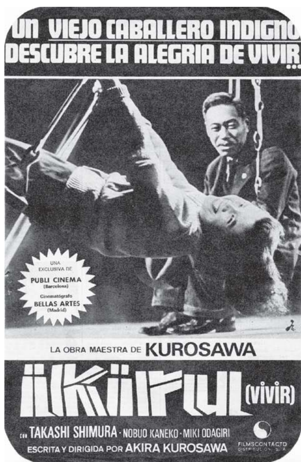
Anuncio de prensa español. Acción: Japón, época del estreno.

http://www.filmaffinity.com/es/film246184.html