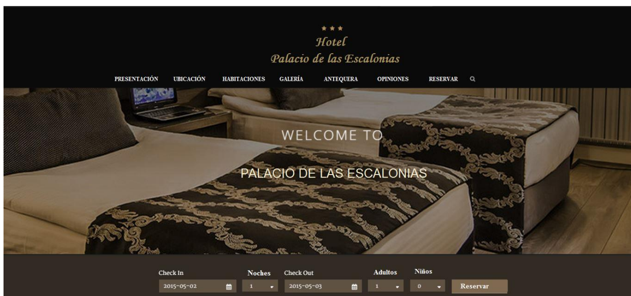
Imagen 4.2. Portada página web Hotel Palacio de las Escalonias

Fuente: http://themes.goodlayers2.com/?theme=hotelmaster . Elaboración propia