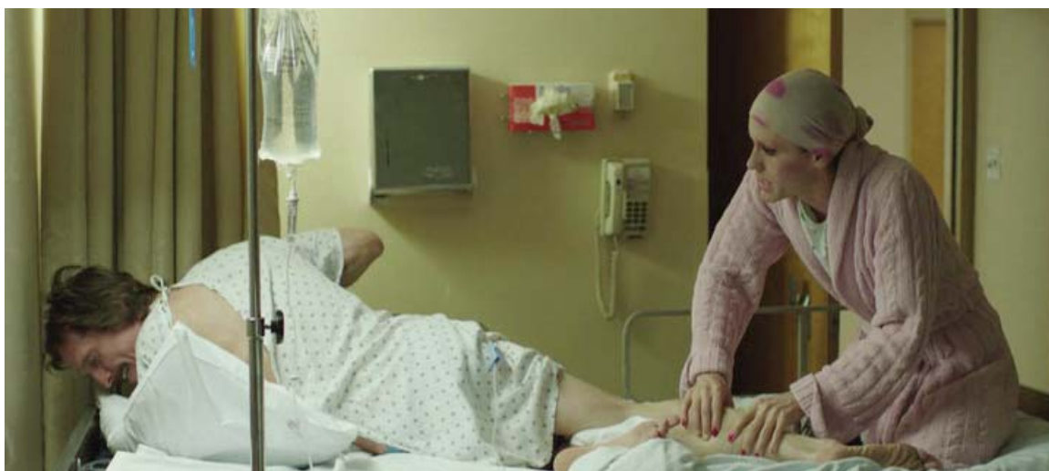
... calambres musculares en su pantorrilla,...