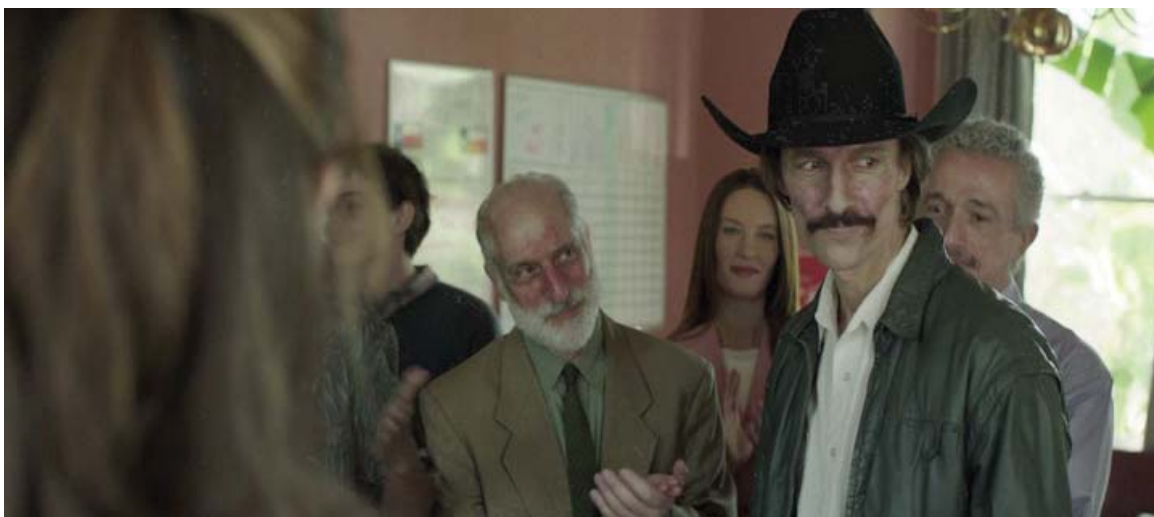
... dermatitis seborreica,...