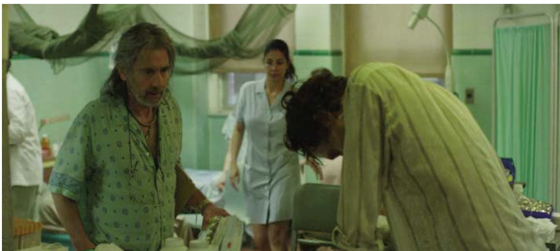
... momentos de gran deterioro,...