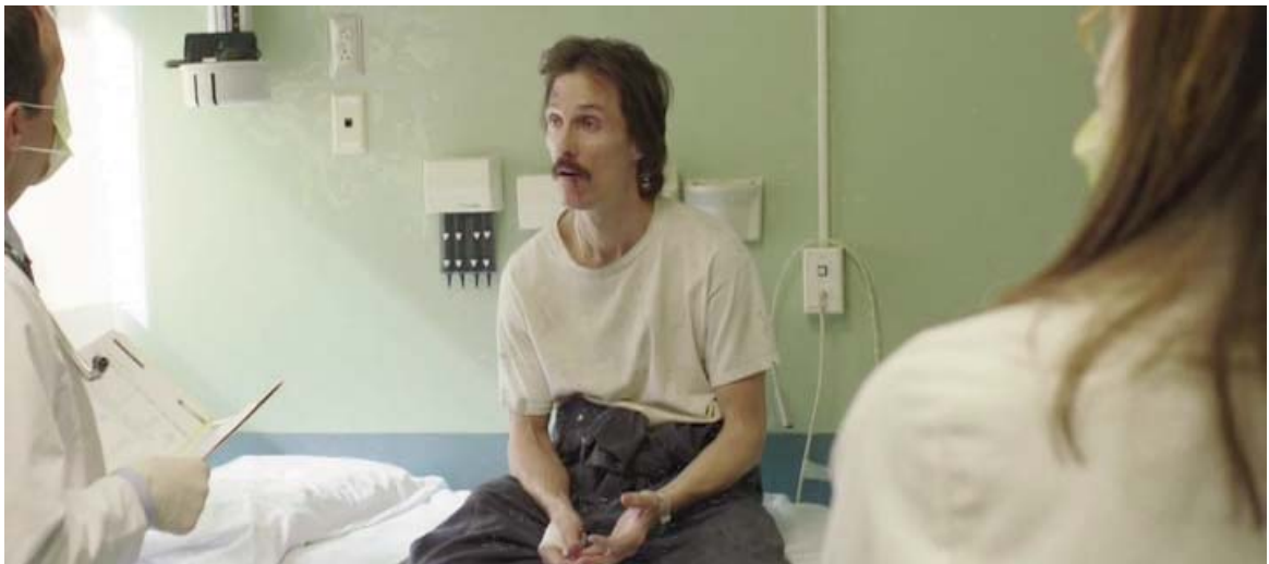
Ron Woodroof padecerá a lo largo de su enfermedad adelgazamiento,...