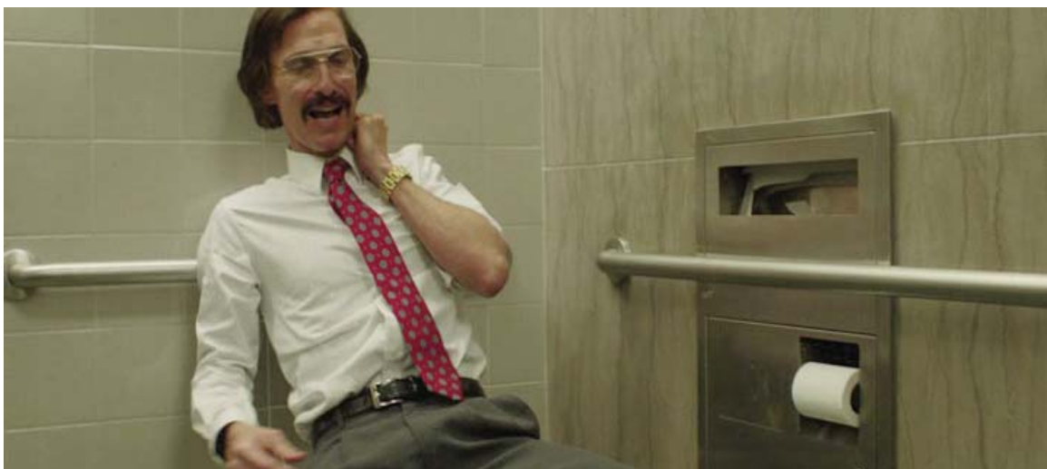
... un infarto de miocardio tras inyectarse un bolo de ¿interferón?,...