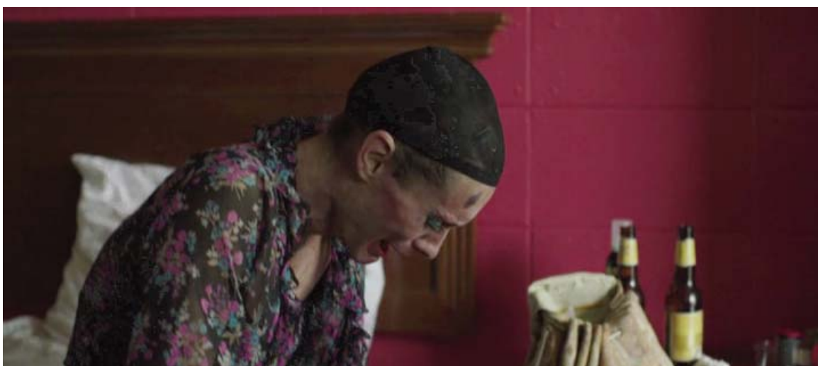
... Rayon presenta un sarcoma de Kaposi en la frente.