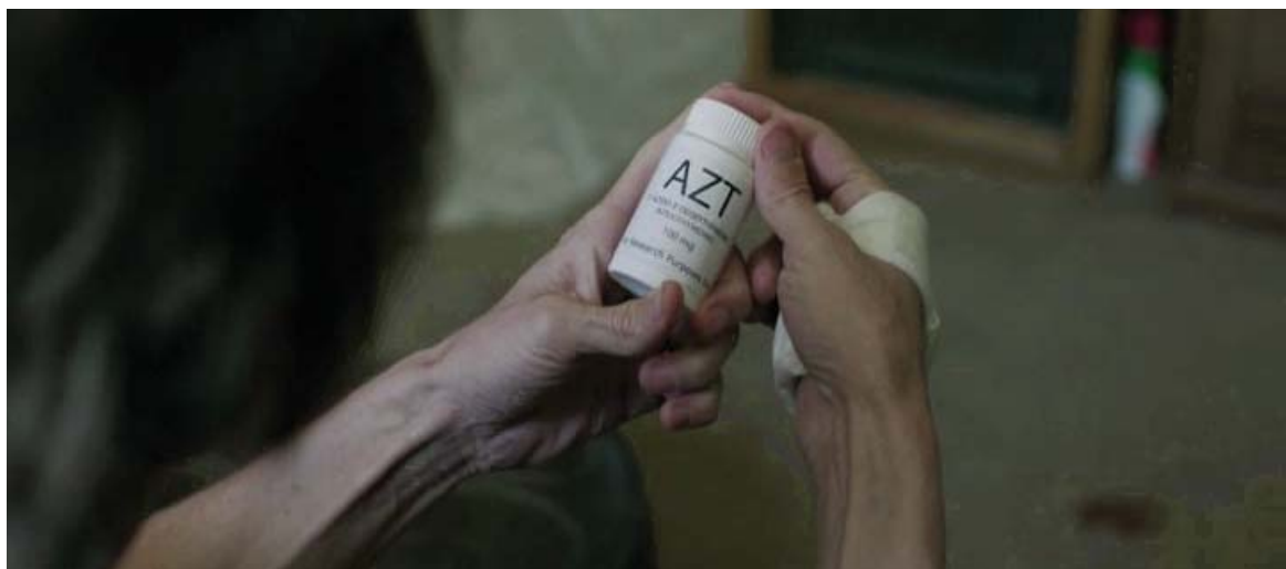
Rayon toma inicialmente AZT,...