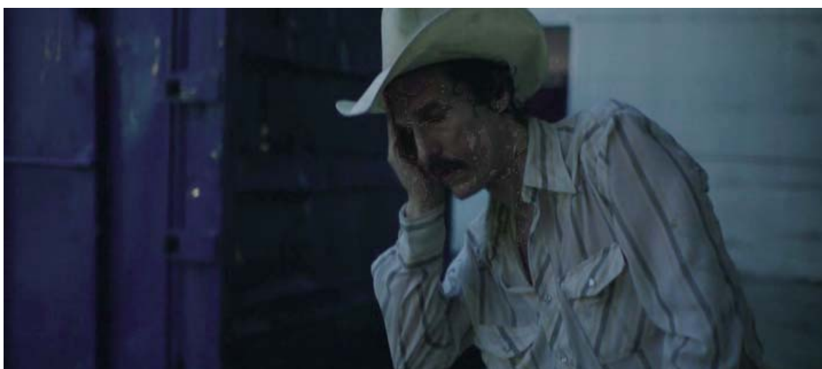
... dolor de cabeza,...