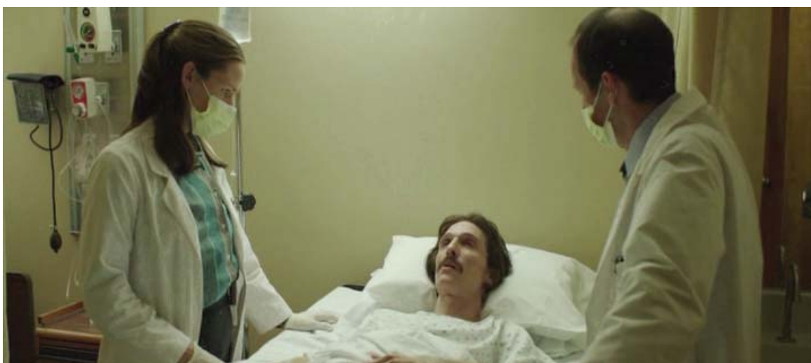
... ingresos hospitalarios,...