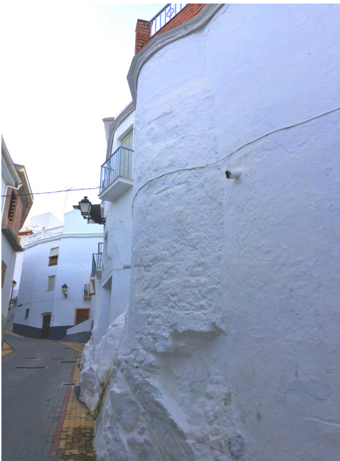
FIGURA 4. Vista de la estructura semicircular situada en la calle Alozaina.

En la actualidad, la estructura se encuentra también habitada formando parte de una vivienda de la calle Alozaina, fenómeno que se constata documentalente en muchas ocasiones a finales del siglo XVI, valga de ejemplo la referencia a una casa «que alinda con un muro e con la calle Real, e no entra en esta morada la dicha torrecilla porque es de otro poblador» 33 . Si bien la vivienda que hoy ocupa la torre n.º 4 presenta una entrada lateralizada de marcado carácter defensivo, a la cual se accede mediante un estrechísimo adarve que le sirve de servidumbre. En lo que a nosotros interesa, llama la atención que no tenga acceso directo por su fachada principal a la calle, lo que hubiera hecho innecesaria la apertura de dicho adarve.