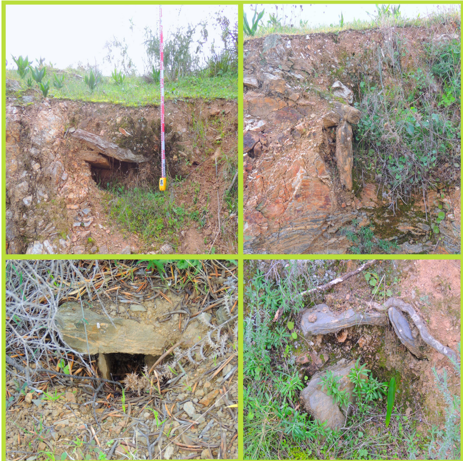
FIGURA 7. Estructuras de enterramiento en los perfiles abiertos por el camino forestal.

El sistema constructivo empleado en los sepulcros consiste en la excavación de una fosa en tierra y su delimitación con lajas dispuestas en vertical, con la salvedad de una de las estructuras, que solo conserva la losa de cubierta reposando sobre la fosa. Las lajas laterales disponen de un grosor aproximado de 3 y 7 cm, exactamente igual que las losas de cubierta, que por su parte están calzadas para su nivelación, con una media de 70 cm de largo por 60 de ancho.