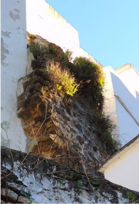
FIGURA 2. Aspecto actual de la estructura n.º 1 aprovechando el desnivel del Barranco de Amador.