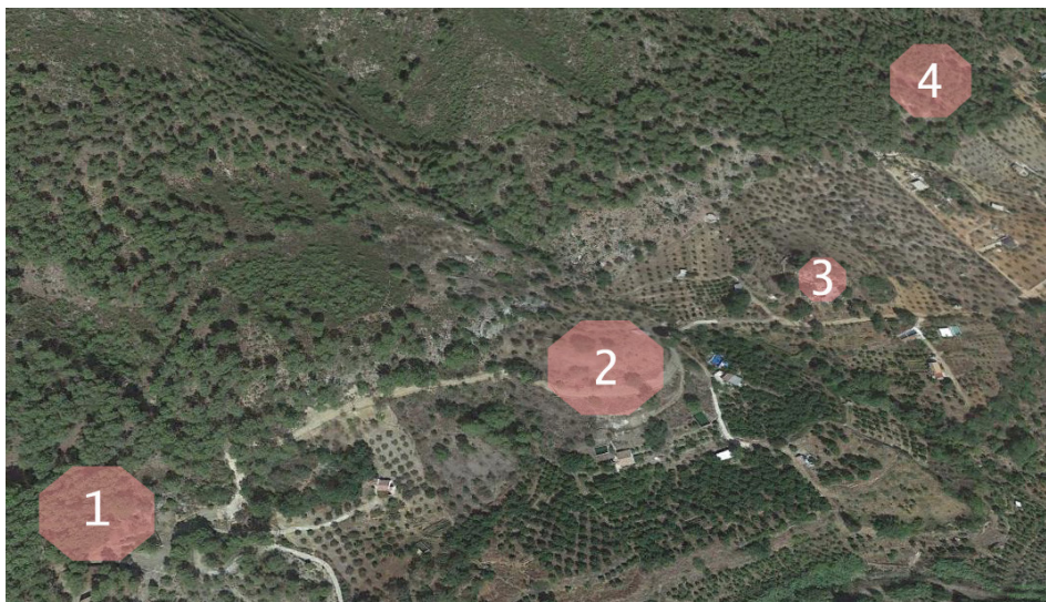
FIGURA 8. Localización de los enclaves documentados en el valle del río Alfaguara: 1. Llanillos del Piloncillo ; 2. Despoblado de Robaquel (Alfaguara) ; 3. Peñón de Robaquel ; 4. Llanos del Tejar . Mapa: F. Marmolejo.