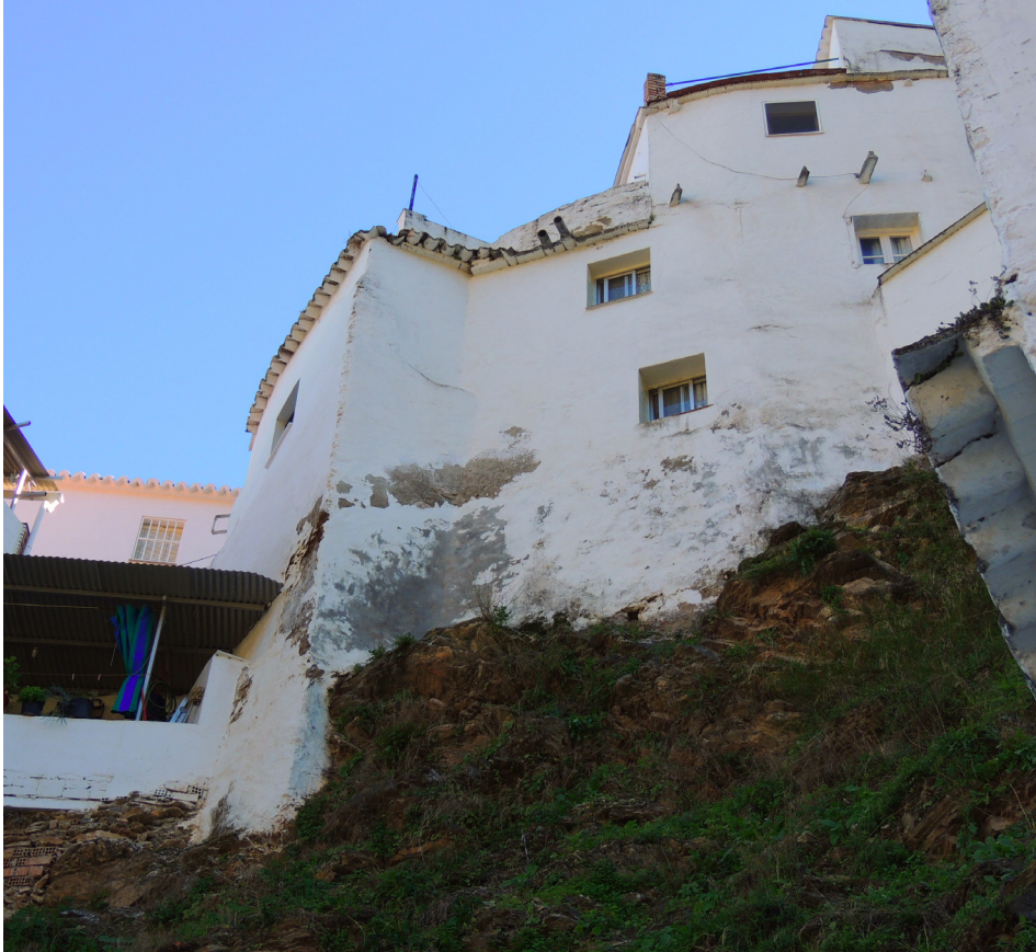
FIGURA 3.- Alzado de la estructura n.º 2, hoy integrada en una vivienda con entrada por la calle Castillo.

Villa Baja con la de Alosaina. Siguiendo esta línea de argumentación, la documentación histórica insiste en que la muralla se desarrollaba y subía por la antigua calle Real, que comprendía la actual calle Alosaina con dirección a la Calzada de la Iglesia, donde confluía con la otra calle Real a la altura de la torre-campanario 31 .