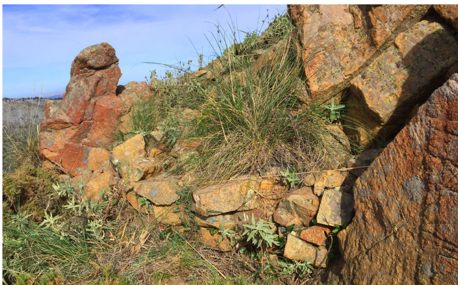
FIGURA 6. Primeras hiladas del recinto exterior que bordea la cumbre del cerro.

Estamos ante un reducto de pequeñas proporciones de cronología altomedieval, atendiendo al registro arqueológico perceptible en un contexto superficial. Se alza sobre una cota de 1.299 msnm, en un cerro elevado a los pies de la sierra de las Nieves, con importantes defensas naturales en todas sus vertientes y amplio dominio visual. Su función estratégica es incuestionable, dada su privilegiada situación, manteniendo contacto con casi todas las fortalezas altomedievales de la comarca 48 . Sus pequeñas dimensiones permiten caracterizarlo como fortín con claras funciones militares, idóneo para albergar una reducida guarnición, similar en tamaño a los existentes en el puerto del Viento y cerro de Ardite (TM de Alozaina) 49 , sin duda para control y vigilancia del territorio circundante, y en especial sobre los puertos de Corona y Golondrinas.