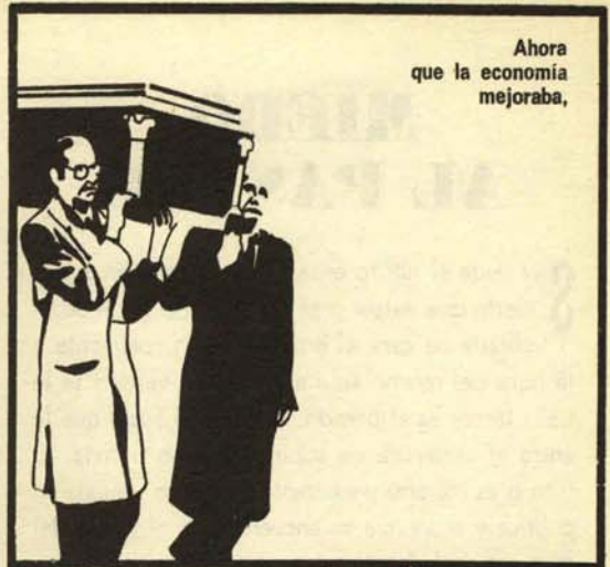
Ahora que la economía mejoraba,

O sea que me entra la risa nerviosa cuando oigo hablar de readaptación, continuismo, cobardía moral o moderación organizada. Como noble patricio de las letras que soy, los periodistas vienen con frecuencia a preguntarme si esto es la crisis, el final, el principio, la restauración, el canovismo, el error Berenguer o qué. Y yo les digo que es el sensurround. O sea, que nos vamos a tomar por retambufa, pero dentro de una legalidad. Ya la palabra lo dice: sensurround.— LORD.