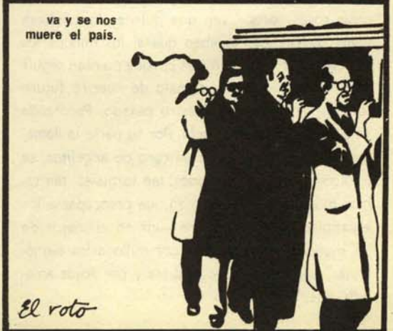
va y se nos muere el país.