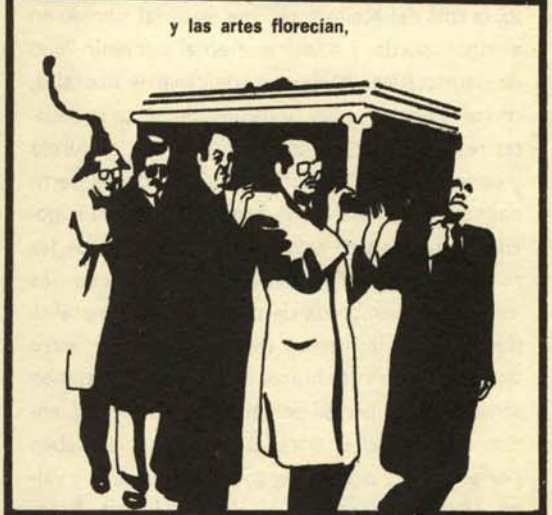
y las artes florecían,