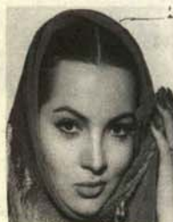
SARA MONTIEL (Actriz y neoliberal de toda la vida)