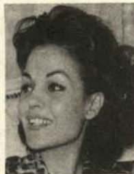
CARMEN SEVILLA (Actriz, cantante y abandonada)