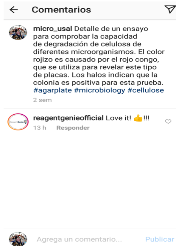
Figura 3. Ejemplo de comentario recibido para una de las imágenes.

Además, la herramienta permite la interacción con los usuarios, y muchos de ellos hacen comentarios o realizan preguntas respecto a una imagen en concreto (Figura 3).