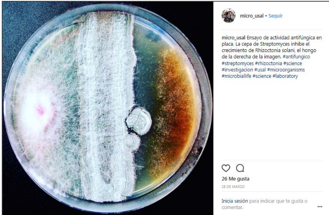
Figura 2. Ejemplo de publicación en nuestra cuenta de Instagram.

Durante este curso académico hemos llenado la cuenta de contenido. En concreto, hemos alojado 77 publicaciones. Cada publicación consta de una imagen o un video y un texto explicativo (Figura 2).