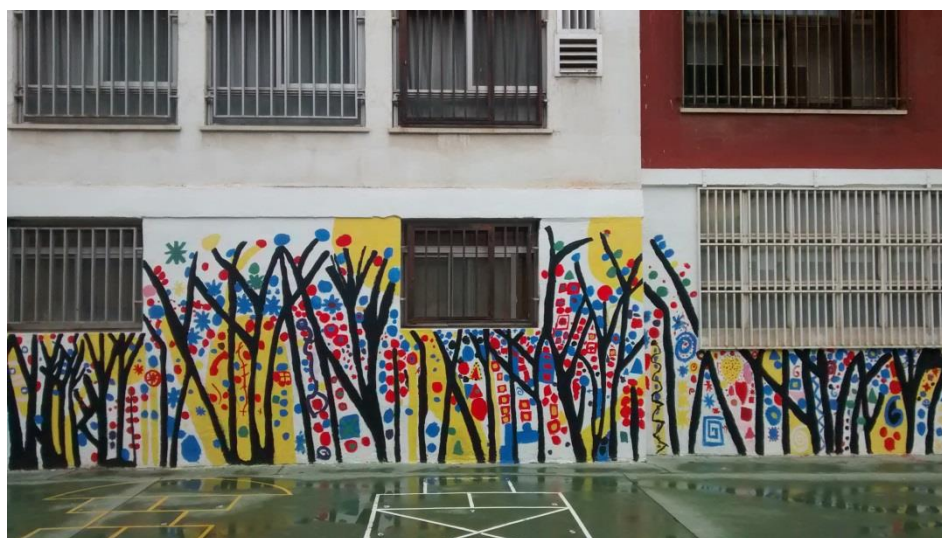
El patio ilustrado