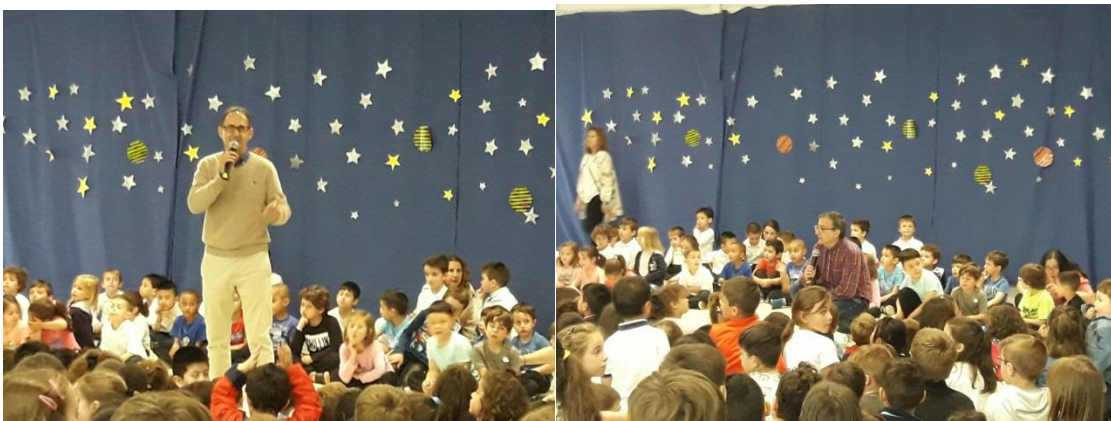
Difundir y explicar los valores artísticos para sentir su vitalidad