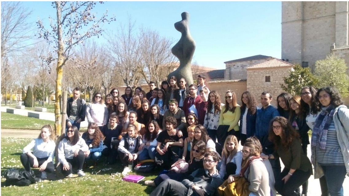
La colaboración de todos crea sentimientos de afecto y unión