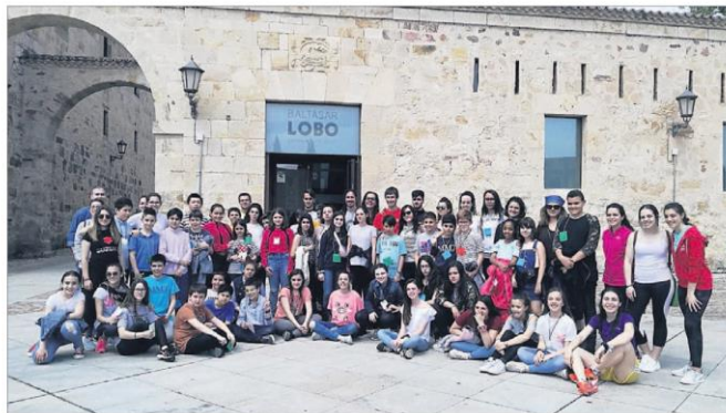
Alumnos del colegio Arias Gonzalo y estudiantes de la Escuela de Magisterio de Zamora, durante la jornada en el Museo Baltasar Lobo.

El proyecto, desarrollado desde el Campus Viriato, cuenta con la colaboración de la Dirección Provincial de Educación y el Ayuntamiento