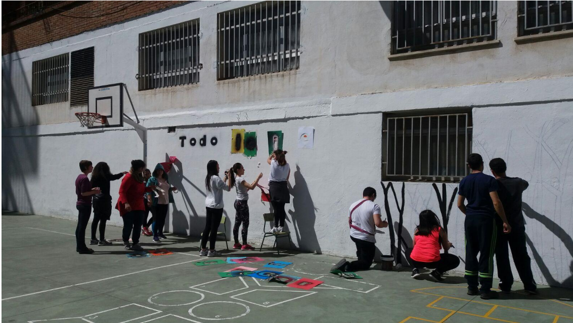
Construir el propio aprendizaje y su difusión colaborativa

El proceso creativo llevado a cabo por tantos participantes, estudiantes, escolares, profesores y maestros, confluye en una lógica de presentación y exposición abierta, donde las autoridades educativas y los medios de comunicación realizan su parte de apoyo y de divulgación.