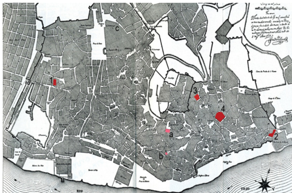
MAPA 2.- As sucessivas sedes do Estudo em Lisboa (Planta de Tinoco, 1650), segundo Rui Lobo, 2013, p. 302-303.

Nada traduz tão bem a natureza titubeante dos inícios da actividade do Estudo em Lisboa como a localização muito excêntrica que D. Dinis irá escolher para sedear a actividade dos escolares. Posicionou-o o monarca na estrema da cidade, no sítio da Pedreira, de onde se dominava do poente o arrabalde ocidental, área certamente importante na estratégia de desenvolvimento dionisina da cidade – estamos nos primórdios da urbanização desta nova parte alta, polarizada pelos conventos dos franciscanos e dos trinitários e que verá surgir dois séculos depois o Bairro Alto – mas periférica em relação aos bairros tradicionais correspondentes à medina islâmica, ao arrabalde oriental, destino futuro das Escolas, dominado pelo emblemático convento de S. Vicente de Fora, ele próprio um importante pólo de ensino agostiniano, e à Ribeira emergente, que o próprio D. Dinis se ocupava ao tempo de estruturar através da definição de novas artérias e de uma muralha 34 .