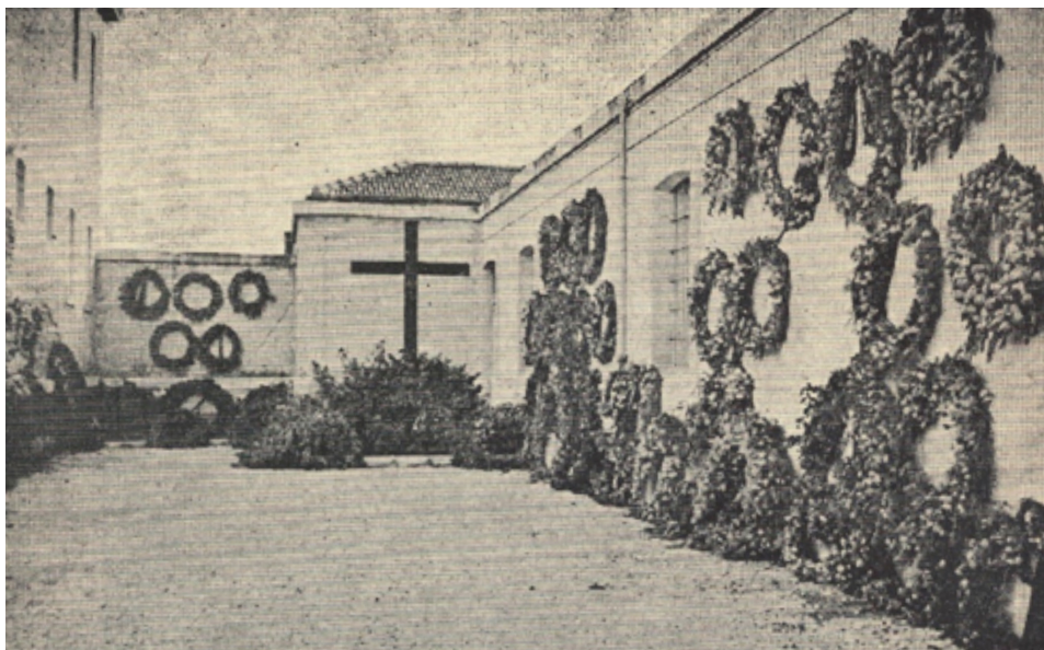
IMAGEN n.º 10. Lugar donde fue fusilado José Antonio Primo de Rivera en 1936 tras ser juzgado por el delito de conspiración y rebelión militar contra el Gobierno de la República. Espacio de la antigua cárcel de Alicante conservado en el Colegio Menor «José Antonio» de dicha ciudad (fotografía tomada en 1953 o 1954, seguramente un día o dos después del 20 de noviembre; de ahí la profusión de coronas).

oscuras, andares bruscos, por no decir agresivos y supuestamente viriles y, en algún caso, con pistola al cinto 13 . Un santuario cuya conservación y salvaguarda nos correspondía y en el que, la noche del 19 al 20 de cada mes, y sobre todo la del 19 al 20 de noviembre de cada año, y durante todo este último día, debía hacer guardia cada «escuadra», por turnos de una hora, en rígida posición de firmes y, por supuesto, con el uniforme falangista, pantalón corto y camisa azul remangada. Esa debía ser nuestra contribución, a cambio de recibir una beca y poder estudiar, a la construcción del mito joseantoniano del «Ausente». También en este caso, como en el de los himnos, banderas y encuadramientos forzados, se me inmunizó frente a todo tipo de cultos personales, tumbas de la realeza o de líderes políticos y, en general, de mitificaciones en vida o post mortem . Las analizo, las estudio, observo sus similitudes y diferencias, me interesan como podrían interesar a un antropólogo, pero soy insensible a ese atractivo que al parecer poseen para la mayoría de las personas. Aunque sea capaz de