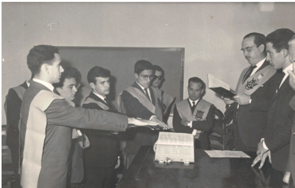
IMAGEN n.º II. Colegio Mayor «Ruiz de Alda». Jura de los «decanos de planta» ante el director y el Jefe provincial del SEU (curso 1961-1962).