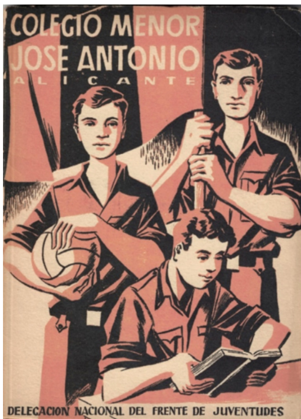
IMAGEN n.º 6. Portada del folleto informativo, publicado en 1954, sobre el Colegio Menor «José Antonio» de Alicante.