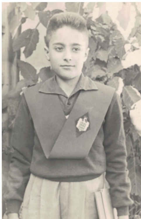
IMAGEN n.º 4. Un estudiante predestinado a serlo. Beca sobre el uniforme colegial –camisa azul, jersey azul con una línea blanca en la parte superior, pantalón gris– y un libro en la mano izquierda (diciembre de 1955).

la mano izquierda. Mi futuro no eran las naranjas, sino los libros. Tampoco estaba en el pueblo, sino fuera de él.