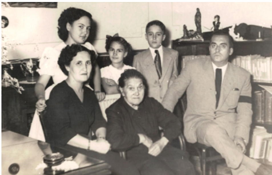
IMAGEN n.º 2. Foto familiar con la biblioteca paterna al fondo (hacia 1953). Buena parte de los libros estaban forrados con un papel fino de color azul claro y titulados al dorso. Sobre la biblioteca, una figura de un «maño» con su vestido tradicional y una escultura metálica de la Virgen de Lourdes.

como Jardiel Poncela 6 . Dicen mis hermanas haber oído a mi padre que tenía una novela de Ramón Sender, Imán o Réquiem por un campesino español , de quien fue amigo o a quien conoció, con una dedicatoria personal. En algún momento debieron pensar que, dada mi bibliofilia, me había apropiado de ella. La verdad es que, si la hubo, nunca la vi. Debí quemarla, por la cuenta que le traía, poco antes de que llegaran las tropas franquistas, como otros tantos libros de signo anarquista-libertario o comprometedores. Como alguna vez oí decir a mi padre, en la guerra tuvo que quemar parte de su biblioteca en dos ocasiones, según que la zona de «La Franja», donde vivía, fuera ocupada por uno u otro bando. En mi pueblo, Albelda, llegaron a establecerse por breve tiempo durante la guerra, como en otros de la comarca, colectividades agrarias anarquistas y proclamarse el comunismo libertario 7 .