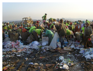
Imagem 2. O lixão e a forma de catação inadequada realizada pelos catadores.

Outro aspecto que merece ser mencionado, embora sujeito a vários questionamentos, foi que o fundo compensatório previsto para atender os catadores(as). Esse fundo era visto como garantia de trabalho e renda no período