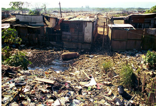
Imagem 3. Tipo de habitação existente até os dias atuais no entorno do lixão de Gramacho.

Pelo observado no Gráfico 1, a situação de perda de rendimentos dos catadores - a partir do encerramento do lixão de Jardim Gramacho - se confirma, haja vista que diante dos dados coletados, até 2012, a renda familiar média era de R$ 1.343,00, aproximadamente 530,00 euros, havendo não raramente casos de ultrapassar os R$ 4.000,00 de renda máxima, em torno de 1.500,00 euros. Ao passo que a renda média dos trabalhadores do Polo de Reciclagem, no ano de 2016, após o encerramento do lixão, era de R$ 300,00 (87,00 euros), sendo bastante