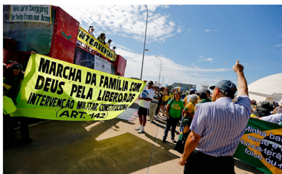
Imagem 1. Pedido de intervenção com base no art. 142 da Constituição (Brasília, abril de 2015). Fonte: Recuperado de [www.folhaonline.com.br]. Consulta do [29-12-2015].

Antes de prosseguir, gostaríamos de retomar uma questão pela qual passamos anteriormente, que é o aparente antagonismo entre o apoio aos militares e a defesa da democracia. Votamos a esse ponto pois, da nossa ótica, ele ajuda a fundamentar melhor as reflexões a seguir. Usaremos os dados da pesquisa que fizemos em Vitória para explicar nosso argumento. Como já dito, 2/3 dos manifestantes consideraram a democracia como sendo a melhor forma de governo. No entanto, quando solicitados a explicitar sua opinião sobre o regime democrático no Brasil, também 2/3 declararam ter alguma crítica, em menor ou maior extensão, à democracia no país.