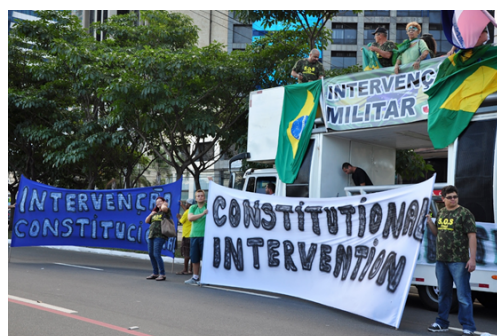
Imagem 2. Pedido de “intervenção constitucional” (Vitória, agosto de 2015).

Não é em outro sentido, por exemplo, que em várias cidades onde ocorreram manifestações contra o governo Dilma Rousseff em 2015 podemos notar faixas e palavras-de-ordem pedindo “intervenção militar democrática” (ou, sem sua variante, “intervenção constitucional”), com base no art. 142 da Constituição de 1988. Embora, presumivelmente, os manifestantes que reivindicaram esse artigo para fundamentar suas posições estivessem atentos à função de “defesa da Pátria” e “à garantia (...) da lei e da ordem” por parte da Marinha, do Exército e da Aeronáutica, o fato é que, no mesmo artigo, a Constituição é bastante clara ao dizer que as Forças Armadas só poderiam exercer esse papel “sob a autoridade suprema do Presidente da República” (Brasil, 1988). Desta forma, do ponto de vista lógico, não