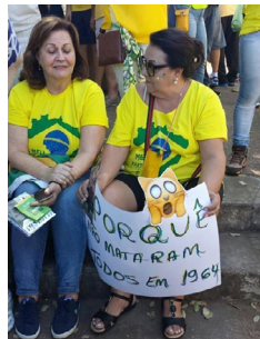
Imagem 5. Cartaz perguntando por que “não mataram todos em 1964” (2015).