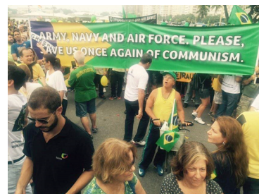
Imagem 3. Cartaz, em inglês, pedindo que Forças Armadas salvem de novo o Brasil do comunismo.