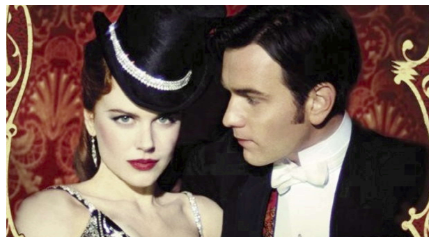
Foto 1. Satine (Nicole Kidman) en danza de amor con Christian (Ewan McGregor).

Satine, la protagonista interpretada por la bella Nicole Kidman, - de quien resalta su exquisita femineidad que vuelve a mostrarnos 16 años después en El sacrificio de un ciervo sagrado / The Killing of a Sacred Deer (2017) de Giorgos Lanthimos - es un ejemplo de esta existencia competitiva, ella expresa: "solo valgo lo que me paguen". Triste realidad vigente en la modernidad.