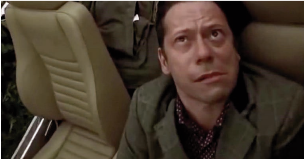
Accidente vascular cerebral (AVC) de inicio abrupto.