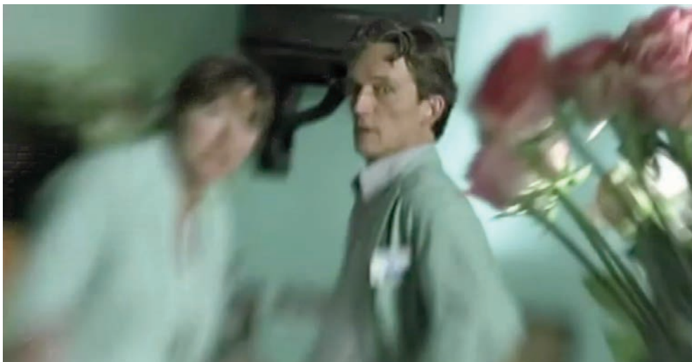
Después de 3 semanas de estar en coma, el paciente despierta.