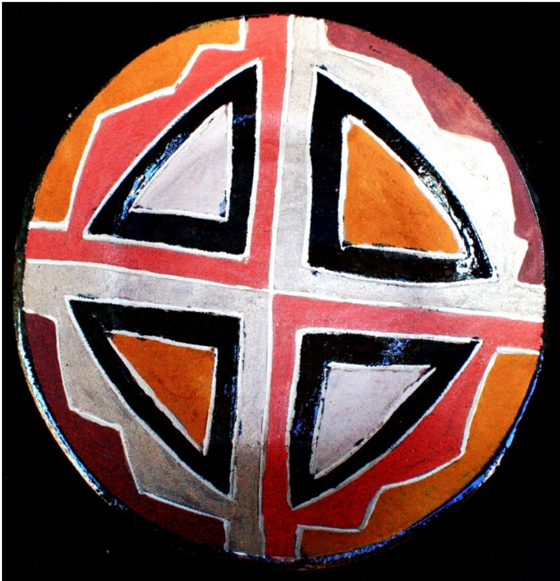
Figura n.º 3. Cerâmica Kadiwéu.

Todos estes argumentos levaram a pensar esta pesquisa como um registro de um fenômeno indígena pelos olhos de uma não indígena, buscando diálogos com o estruturalismo e com a semiótica para tecer proposições e interpretações. Não foi minha intenção compor um tratado sobre a verdade por detrás da produção artística kadiwéu (pois isso seria uma busca vil e inútil), mas uma reflexão sobre os contextos a que estas estão submetidas, vendo tal forma de arte como elemento de interlocução e mediação entre indígenas e sociedade circundante.