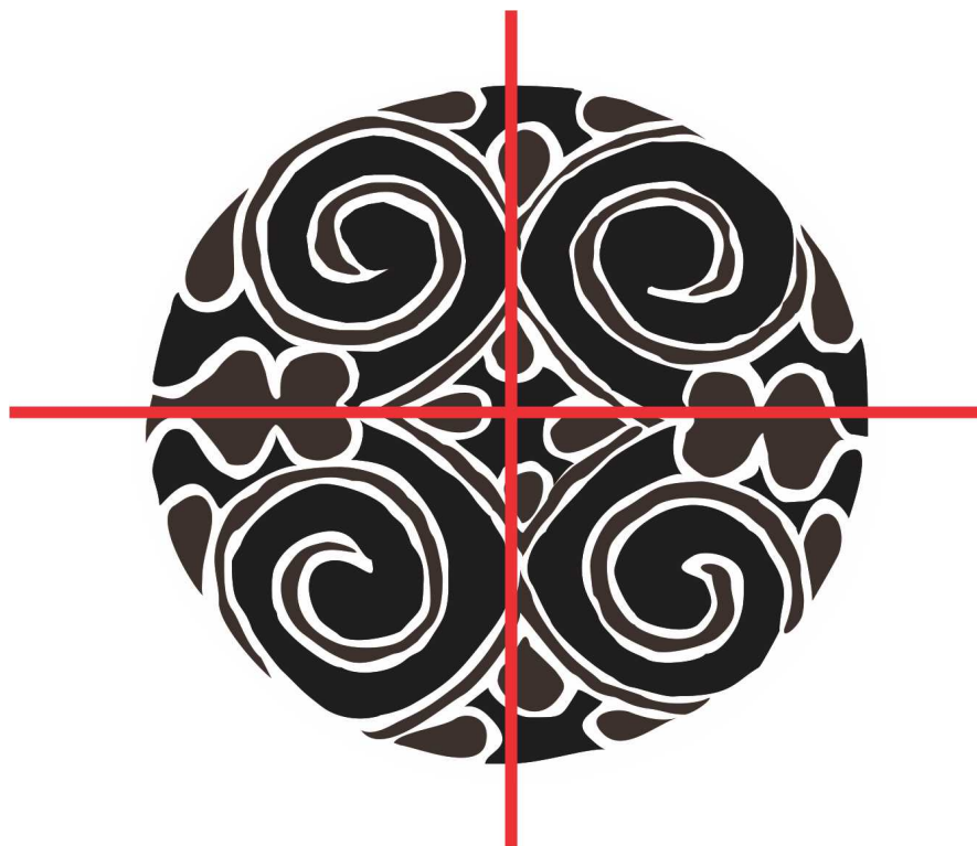
Figura n.º 2. Ao dividir os grafismos que adornam a cerâmica em duas seções, percebemos que tanto no corte horizontal, como no vertical, existe a repetição simétrica do motivo, sendo a simetria e o ritmo a raiz estética da arte kadiwéu.

A organização da força de trabalho revela um importante sistema de oposição estrutural entre homens e mulheres. Tal configuração pode ser um elemento de influência sobre os grafismos que ornam a cerâmica. São sempre muito simétricos, com campos que se repetem de forma integral, porém, espelhada. Este jogo de oposição simétrica, ou de espelhamento de motivos, ocorre em paralelo com certas regras da organização social e cosmológica, igualmente moldada em pares de oposição: Homens versus mulheres, senhores versus cativos, kadiwéu versus não kadiwéu, natural versus humano, mundo dos vivos versus mundo dos mortos; são estruturas que pulsam na vida social kadiwéu e que podem inspirar vários dos motivos que ornam a cerâmica.