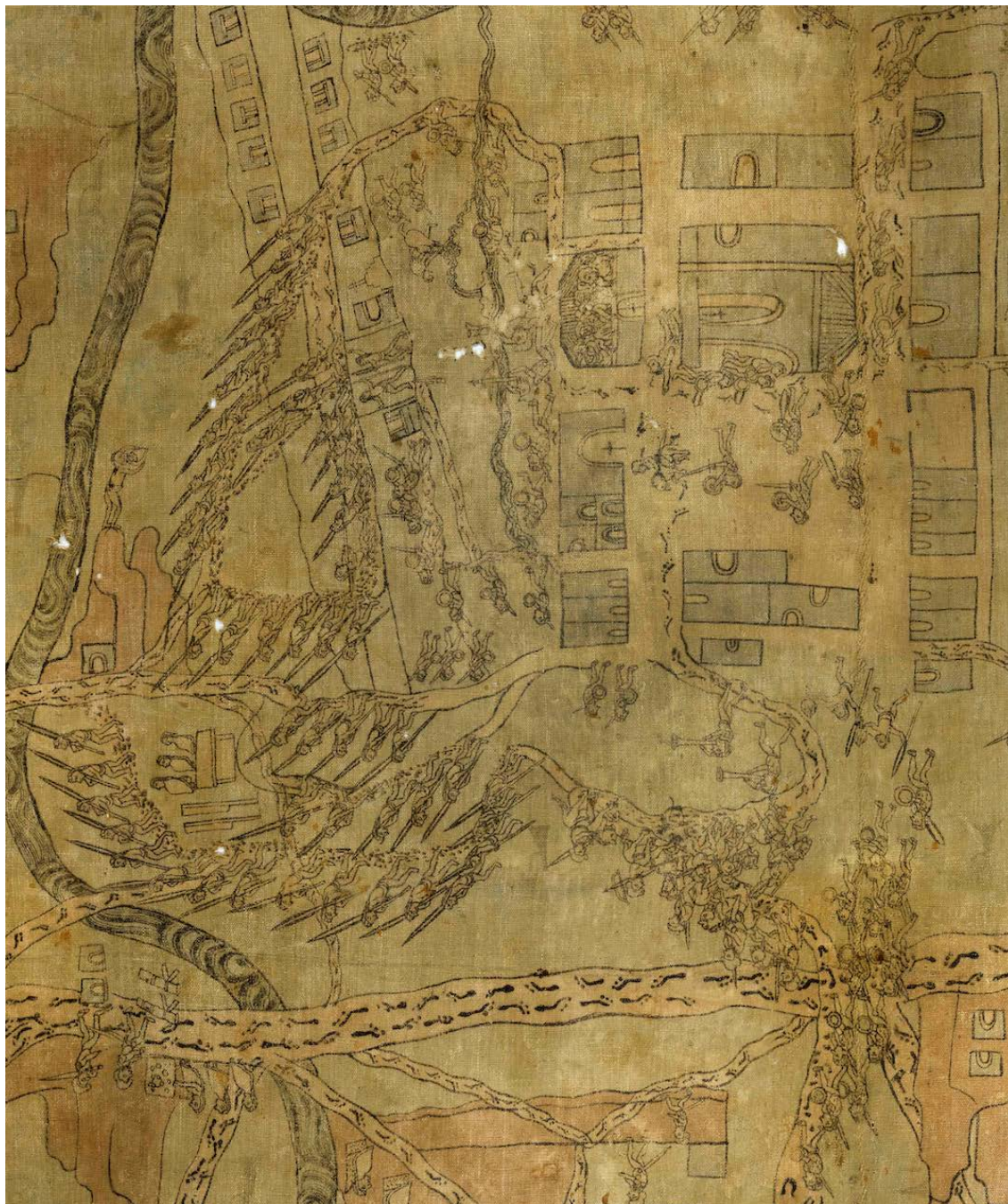
Figura n.º 6. Escena central del lienzo, en la que observamos el ataque perpetrado por indígenas locales –del lado izquierdo– en contra de Villa Alta de San Ildefonso. Por el sur –abajo, a la derecha– vemos la llegada de un contingente de españoles montados a caballo encabezado por indígenas nahuas con trompetas en las manos

indígenas locales que, armados con largas lanzas, avanzan hacia Villa Alta desde el oeste, mientras que, al otro lado de un pequeño arroyo, guerreros nahuas y españoles sostienen en sus manos. Desde el sur, un contingente de españoles montados a caballo avanza hacia la villa, llevando a la vanguardia a dos nahuas con trompetas que parecen anunciar la llegada del grupo.