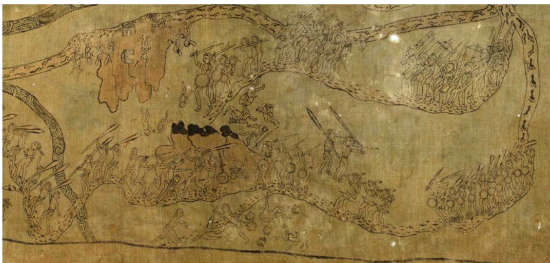
Figura n.º 2. Escena de batalla en Tiltpec

La descripción que hace Díaz del Castillo de la entrada fallida de Barrios, corresponde bastante bien con las escenas ubicadas en la esquina superior izquierda del lienzo, donde se ubica Tiltpec de los zapotecos (figura 2). En esta sección podemos observar una serie de escenas que parecen constituir una secuencia. En el centro de la misma se encuentra Tiltpec, representado como un cerro con la cumbre negra, tal como indica el topónimo en náhuatl, pues Tiltpec significa «en el cerro negro». A este sitio se dirigen nahuas y españoles por dos caminos diferentes. Los españoles —entre ellos arcabuceros y escopeteros— avanzan divididos en dos grupos, al frente de los cuales vemos dos indígenas en collera y, a la vanguardia, tres nahuas armados con espada. Por el otro camino encontramos un nutrido grupo de nahuas, un pequeño contingente de arqueros y dos nahuas que parecen gritar o dirigirse al resto del grupo. Al frente de todos ellos va un español seguido por tres nahuas.