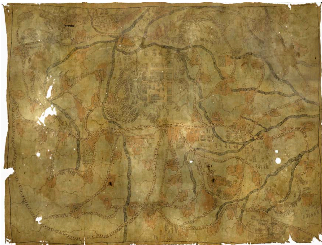
Figura n.º 1. El Lienzo de Analco. Biblioteca Nacional de Antropología e Historia, Secretaría de Cultura, INAH, México 1

El Lienzo de Analco pertenece al acervo de la Biblioteca Nacional de Antropología e Historia de México. Permaneció en Analco hasta la primera mitad del siglo XX, donde fue visto por el arqueólogo danés Frans Blom (BLOM, 1944). Veinticinco años después llegó al INAH tras ser donado por Eugenio Sosa Rodríguez, pero nunca ha sido exhibido, ni tampoco publicado en su totalidad. 2