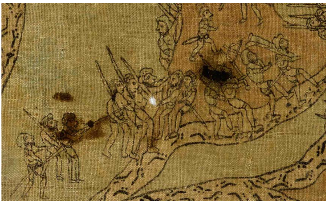
Figura n.º 4. Enfrentamiento al pie del cerro de Totontepec entre dos españoles

Es posible entonces que el enfrentamiento que vemos al pie del cerro de Totontepec, ubicado justamente en la región mixe, sea el ocurrido entre estos dos españoles capitanes españoles.