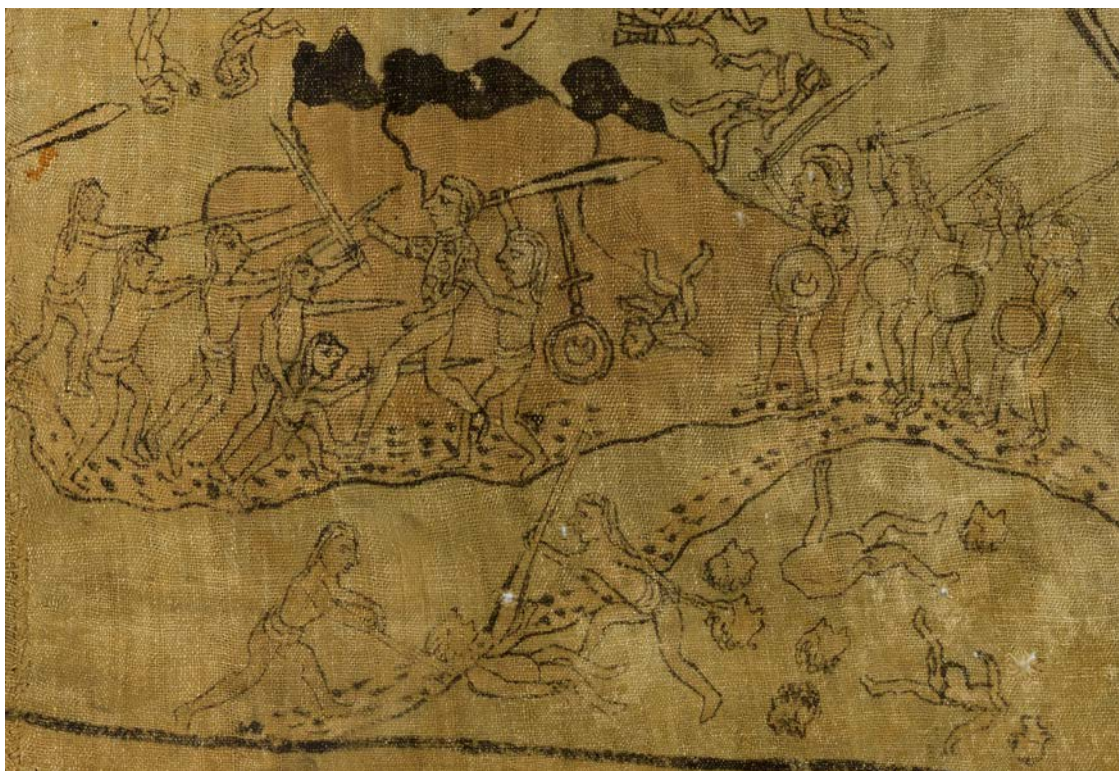
Figura n.º 3. Si leemos las escenas como una secuencia de derecha a izquierda, vemos a un español, probablemente el «fulano de Barrios» mencionado por Bernal, encabezando una entrada militar a Tultepec. No obstante, a continuación lo vemos muerto en las faldas del cerro, según revela el cuerpo que yace en el suelo y, a un costado, su escudo y espada

motivo de media luna. Justo frente a él, observamos un personaje tirado a las faldas del cerro, mientras a un costado yacen en el suelo también una espada y un escudo con motivo de media luna: se trata entonces de una escena en secuencia, en la que observamos en primer lugar al hombre comandando una entrada militar en la que perdió la vida. En la bifurcación del camino observamos a dos indígenas locales, probablemente zapotecos, que con una lanza cortan la cabeza a un hombre, mientras que a su lado podemos ver dos cuerpos desmembrados y seis cabezas. En total, tenemos siete muertos ahí, además del capitán español (figura 3). ¿Podría tratarse del capitán Barrios quien, de acuerdo con Díaz del Castillo, perdió la vida en Tultepec a manos de los zapotecos, junto con otros siete españoles? Es muy probable que sí.