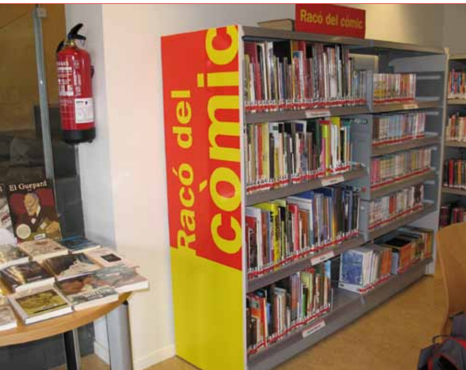
Comicteca de la BPM Pere Blasi de Torroella de Montgrí i P'Estartit (Girona).

En los últimos años ha crecido de manera exponencial todo tipo de acción/actividad lúdico/cultural alrededor del cómic en las bibliotecas. Otra vez no hay que olvidar trabajar en dos frentes: el general y el específico, el local/presencial y el virtual; las posibilidades son muchas: clubes de lectura de cómic para jóvenes/adultos, y también infantiles, completados con blogs; talleres de dibujo/color y de creación de un cómic con el uso de ordenador, también de técnicas de guión; concursos, puntos de libro, relacionar el cómic con la música, el cine, la literatura, el arte, el periodismo, la historia, el turis-