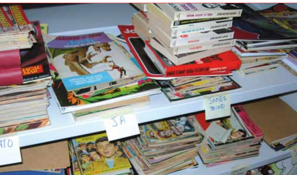
Fondo Luis Gasca, Biblioteca Koldo Mitxelena de San Sebastián.

También podemos encontrar el trabajo de otros colegas, es decir, publicaciones elaboradas por profesionales de bibliotecas: