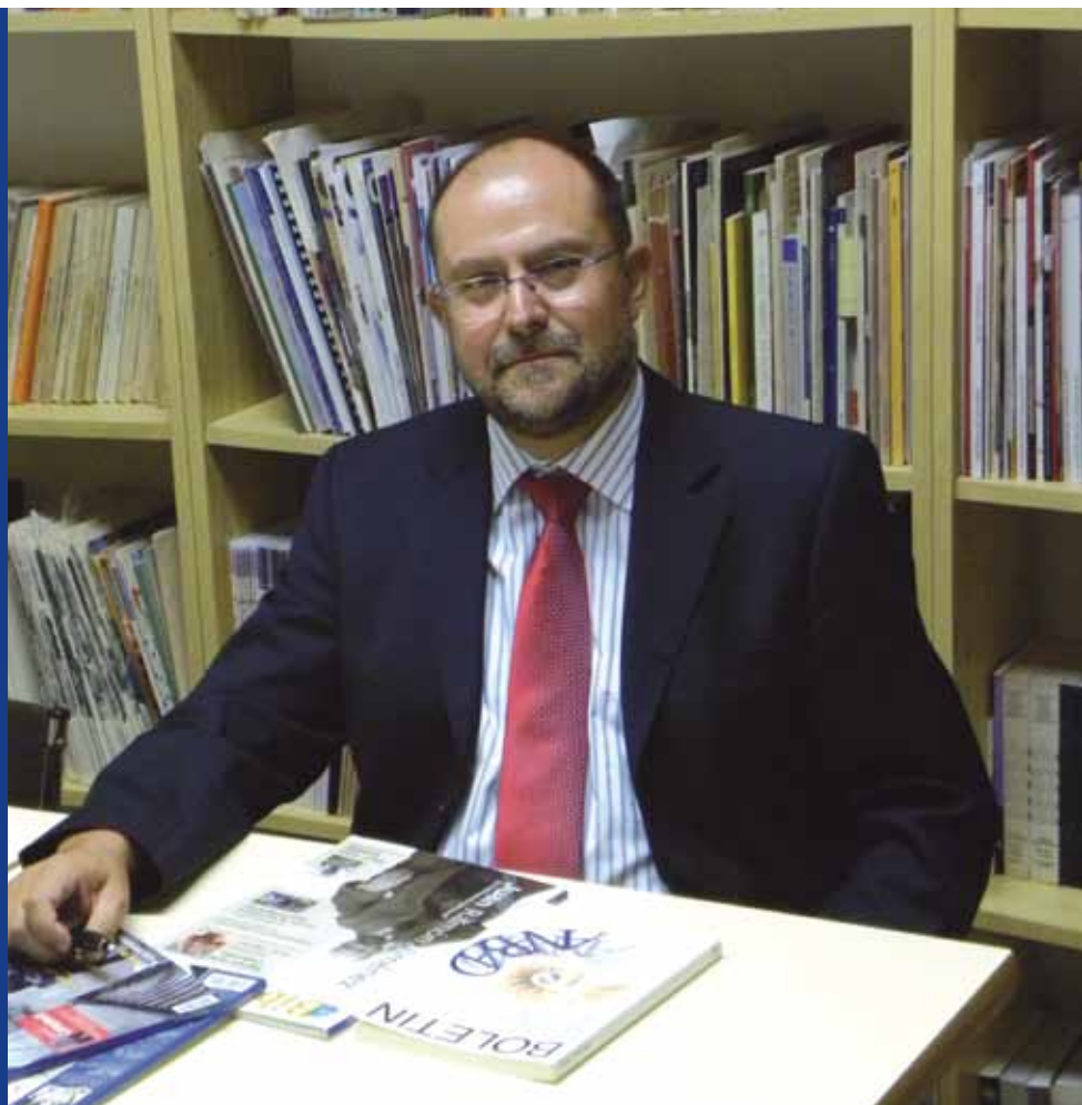
Presidente de ANABAD

“Me parece un grave error el canon por préstamo en bibliotecas”