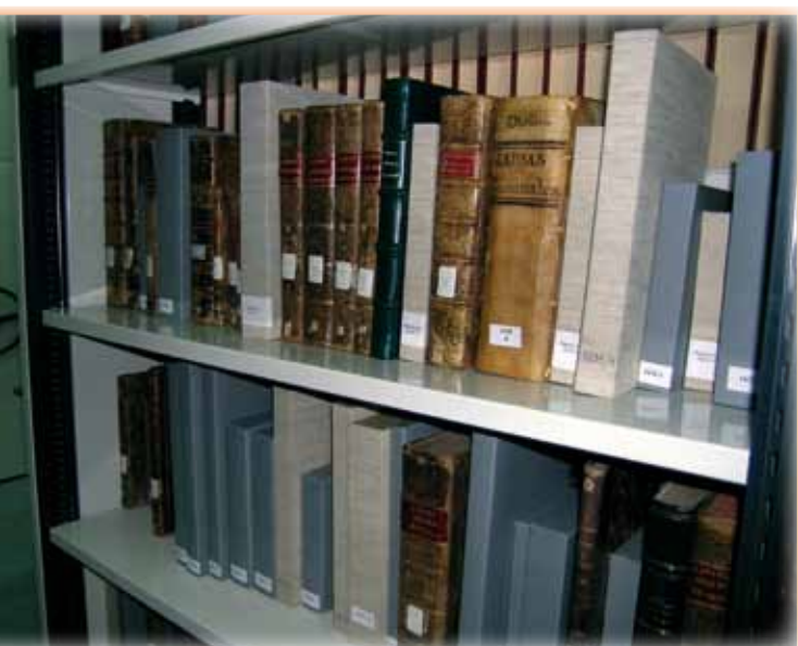
Detalle del depósito

Presta los servicios habituales de préstamo, información bibliográfica, etc. de lunes a viernes en horario de 9 a 14 horas.