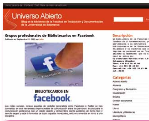
Blog Universo Abierto