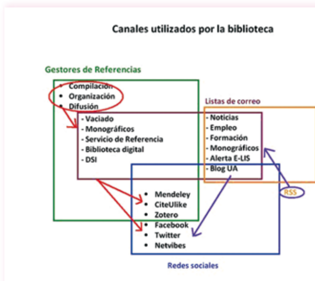
Interacción entre los canales utilizados para retroalimentar y difundir servicios