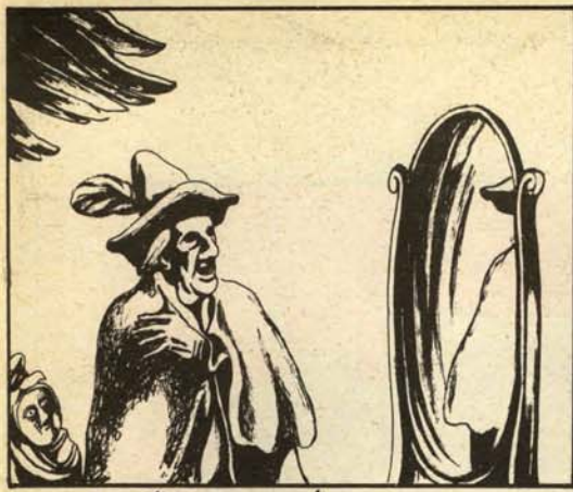
luego le vistió ricamente ...