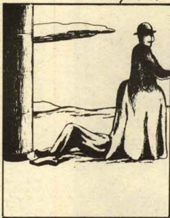
La memoria de aquel hombre nunca le abandonó...