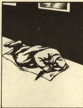
... y aun le espera.