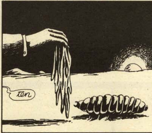
Cuando ya amanecía le devolvió sus harapos...