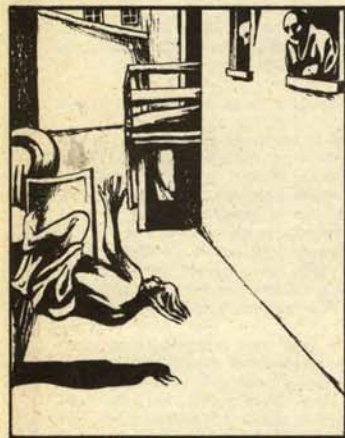
... y le dejó de nuevo en la acera.