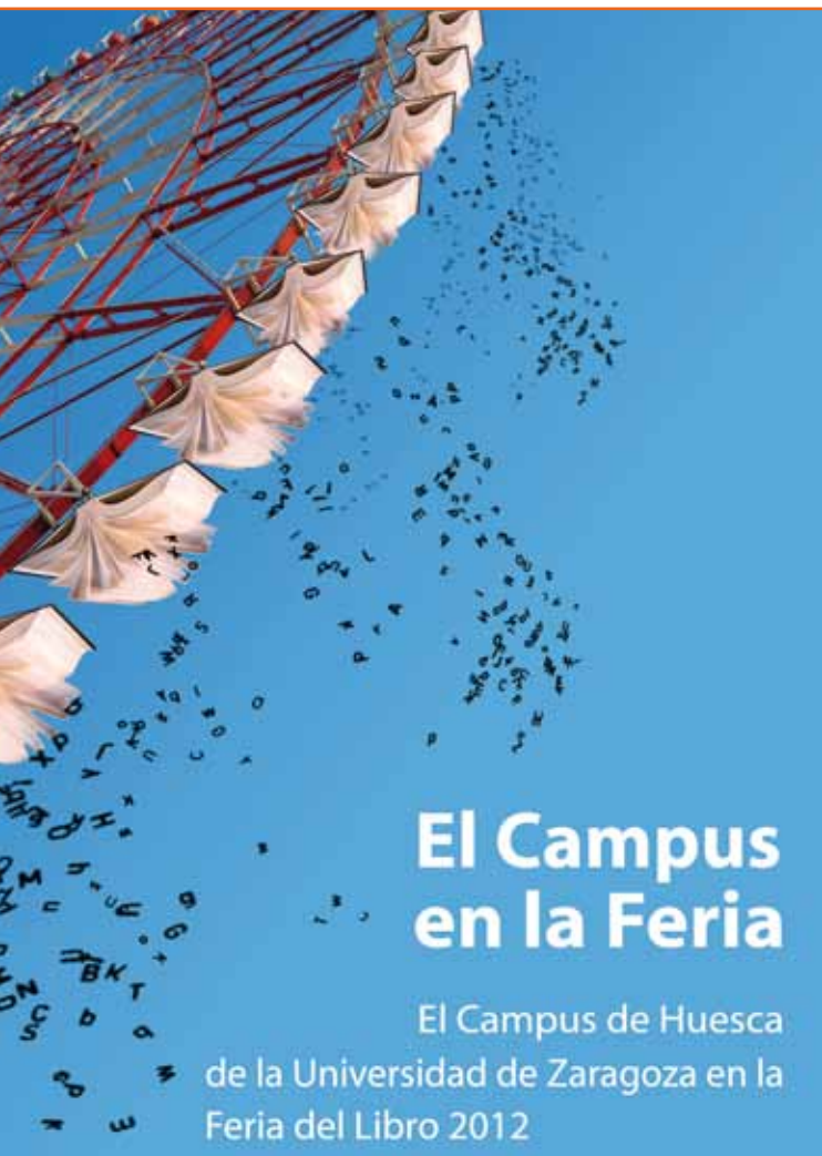
Cartel de la Feria

dad de actividades era el caldo de cultivo ideal para la participación en la Feria de las bibliotecas universitarias del campus oscense.