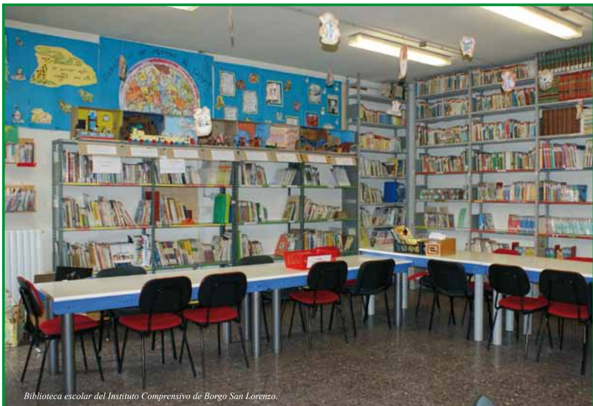
Biblioteca escolar del Instituto Comprensivo de Borgo San Lorenzo.

De estas “normas” creadas por los propios escolares se puede deducir una de las grandes diferencias que existe entre una biblioteca escolar (considerada por sus usuarios como algo propio) y la sección infantil de una biblioteca pública (donde se da cita toda la ciudadanía).