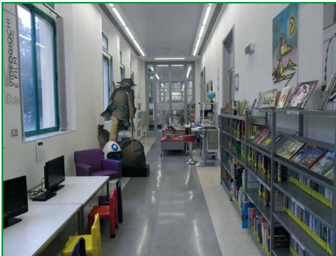
Biblioteca de Scandicci.

El proyecto nace de la conciencia de un doble fracaso: por un lado, las prácticas de lectura consolidadas en la didáctica escolar no han conseguido suscitar en los jóvenes el placer por la lectura no obligatoria, y por otro lado, las bibliotecas públi-