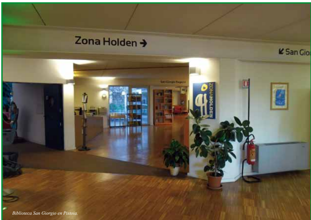
Biblioteca San Giorgio en Pistoia.

La biblioteca colabora con las escuelas del entorno y también con las familias mediante la programa-