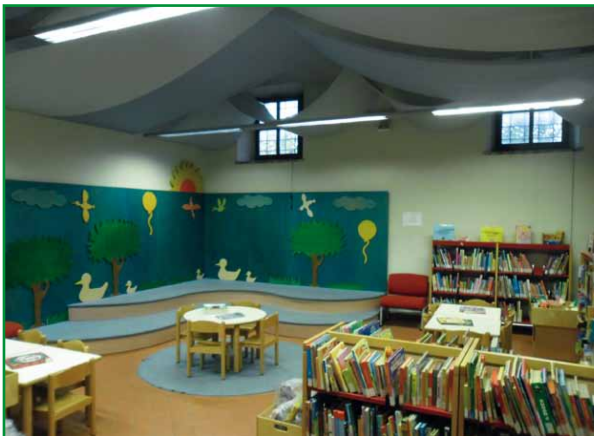
Biblioteca Villa Montalvo en Campi Bisenzio.

- Para los más pequeños . En la sala infantil de la biblioteca hay una pequeña zona de lectura “protegida” que facilita la relación entre niños y adultos. En este rincón hay un baby point reservado para poder amamantar a los niños mientras se les lee, y en el baño hay también un espacio para cambiar pañales.