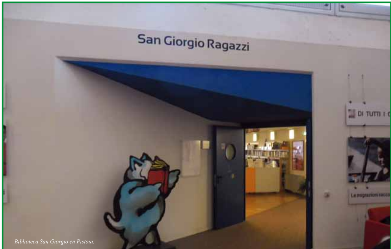
Biblioteca San Giorgio en Pistoia.