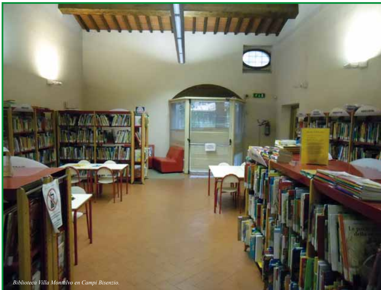
Biblioteca Villa Montalvo en Campi Bisenzio.

Todo ello tiene su reflejo en el ciberespacio a través de Liberweb , el portal sobre la producción bibliográfica