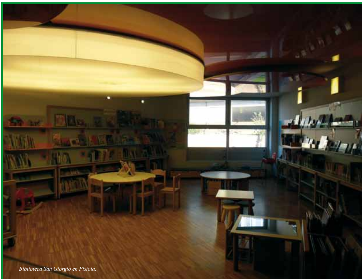
Biblioteca San Giorgio en Pistoia.

siglo XVIII. En este mismo lugar tiene su sede el Museo del Tejido.