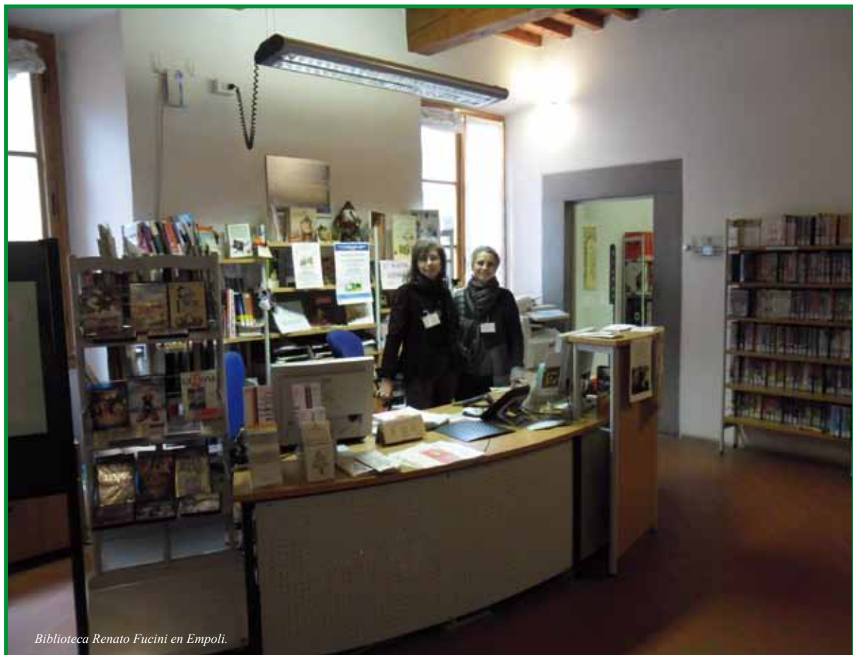
Biblioteca Renato Fucini en Empoli.