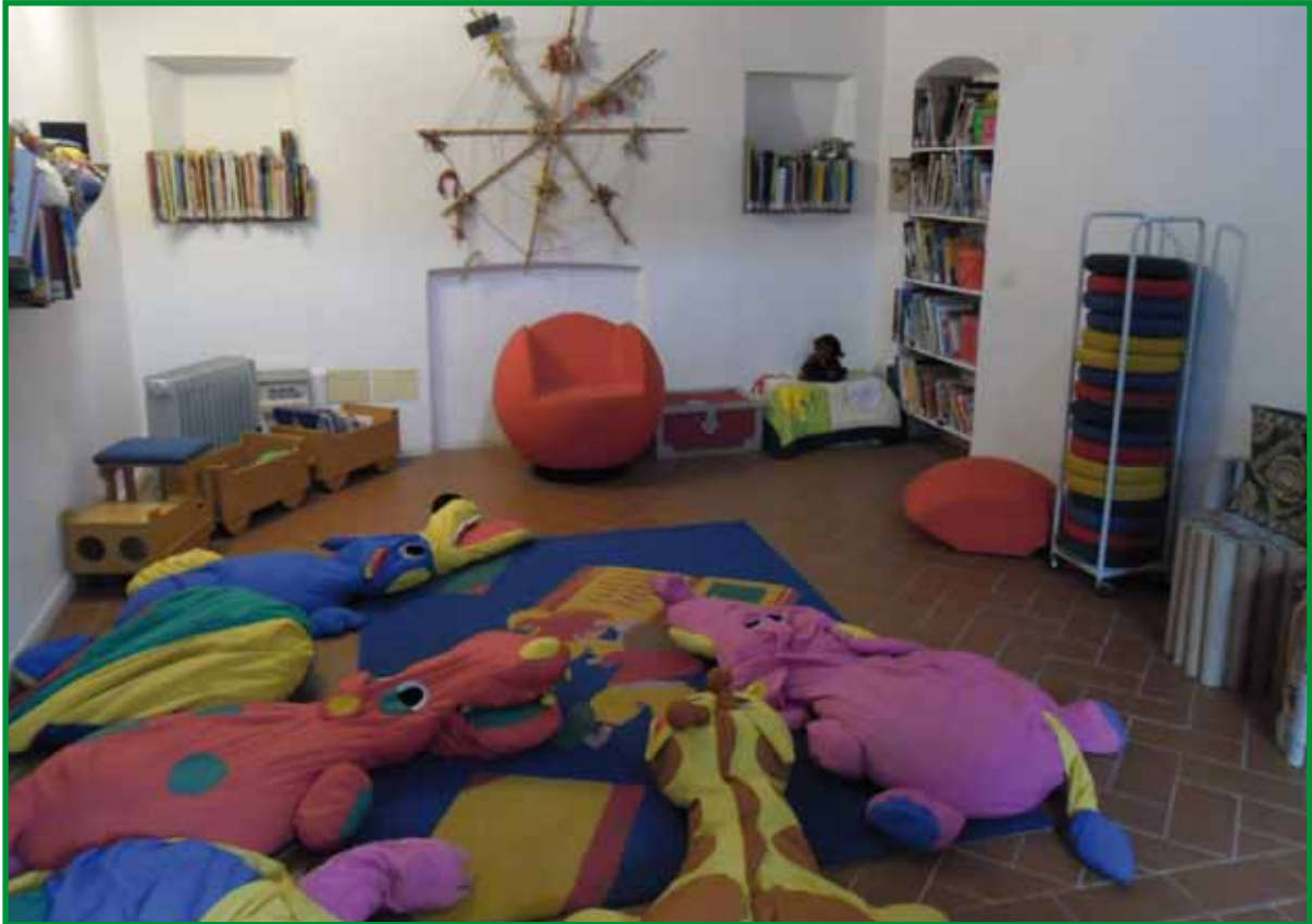
Biblioteca Renato Fucini en Empoli.

Este proyecto para los más pequeños ha sido promovido por el Ayuntamiento de Campi Bisenzio en colaboración con la asociación Madres Amigas de Campi Bisenzio.