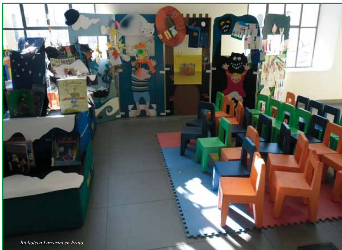
Biblioteca Lazzerini en Prato.