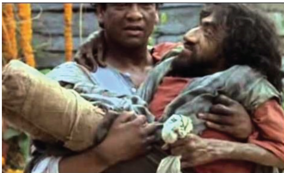
Foto 4: Ayuda mutua, un personaje coge en brazos a otro con secuelas por la lepra en extremidades inferiores y superiores.