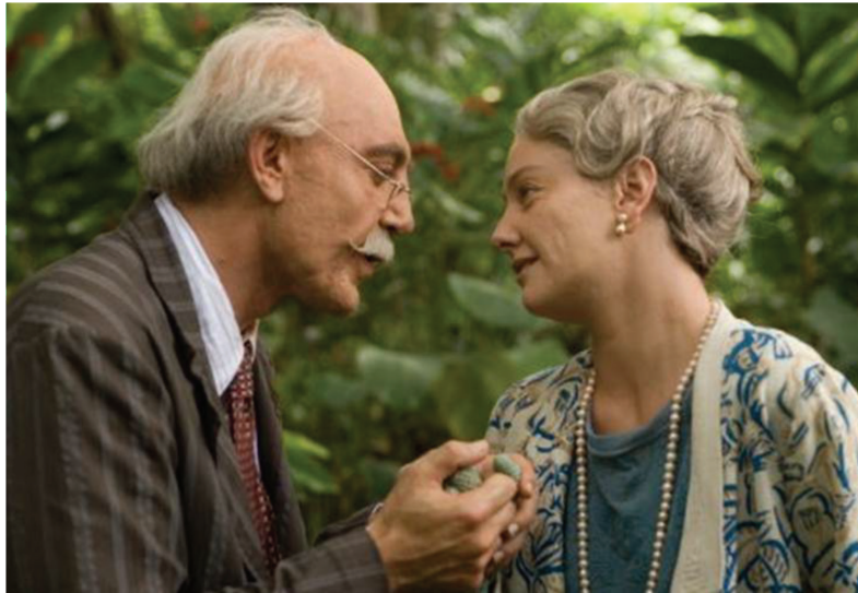
Foto 2. Florentino Ariza y Fermina Daza, en el reencuentro tras las experiencias de amor y muerte que han tenido cada uno de ellos.

la capacidad de afrontamiento, la resiliencia ante la adversidad.