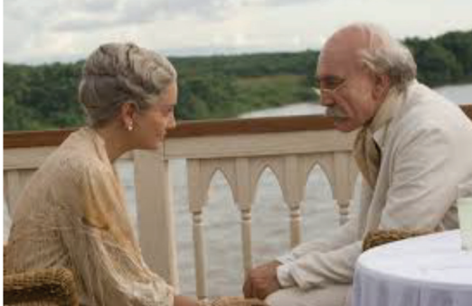
Foto 3. Fermina Daza y Florentino Ariza en el barco juntos en su amor.

“Era todavía demasiado joven para saber que la memoria del corazón, elimina los malos recuerdos y magnifica los buenos, y que gracias a ese artificio, logramos sobrellevar el pasado” Nos remite al afrontamiento del duelo, implicación activa en el propio afrontamiento para conseguir