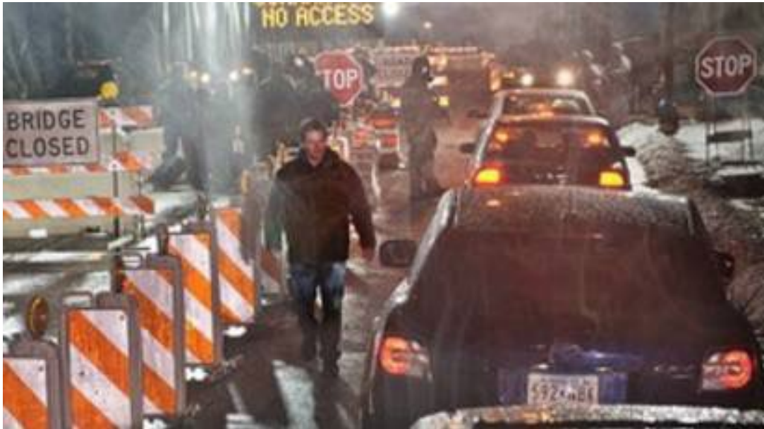
6. Medidas de contención: cuarentena y cierre de fronteras.