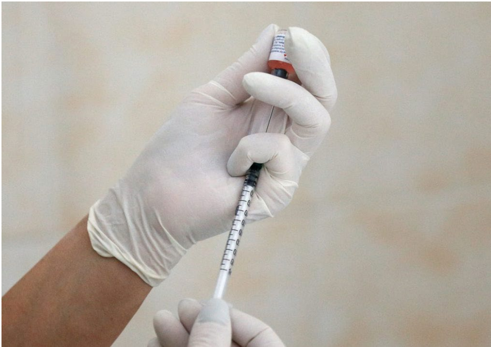
8. Tratamiento: la vacuna.