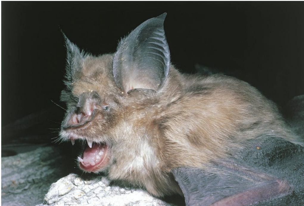
2.1 Hospedador intermedio.