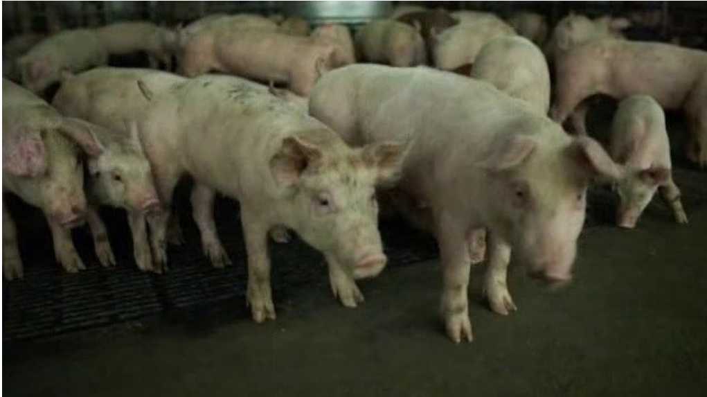
2. Fuente de Origen: Zoonosis. Hospedador definitivo.