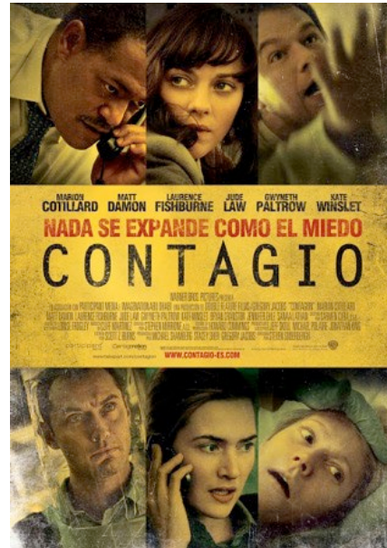
Cartel español Acción: alrededor de 2010 (Hong Kong, Chicago, Atlanta, Minneapolis).