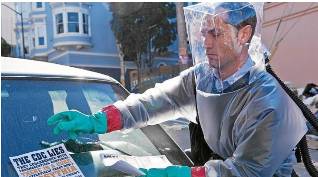
7. Reacciones: difusión de información falsa o desinformación.