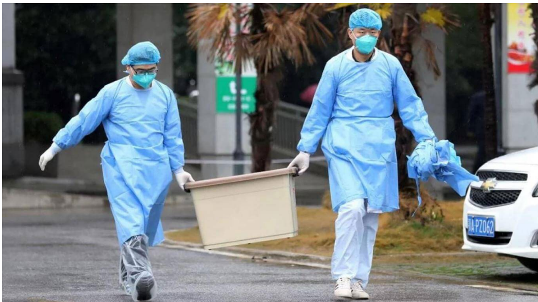
6.1 Uso de tapabocas, guantes y trajes aislantes.