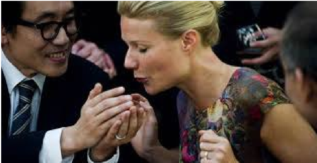
3. Formas de transmisión: el contacto con persona infectada o con superficies tocadas por personas infectadas.