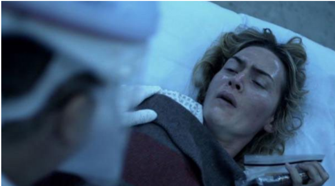
5. Manifestaciones clínicas: fiebre, dolor de garganta, tos, sudoración, malestar general.