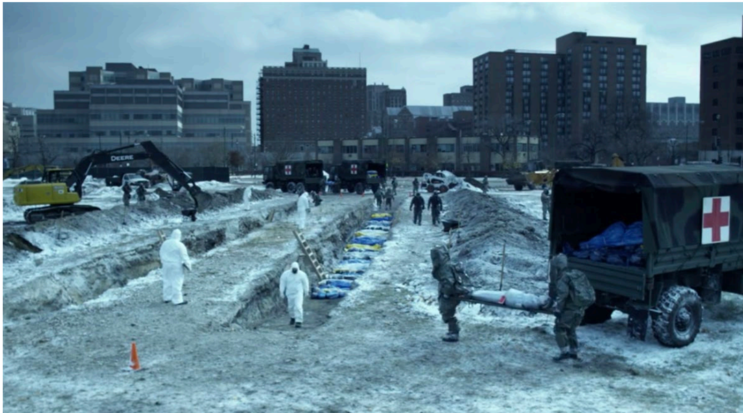
6.2 Cremación de cadáveres.