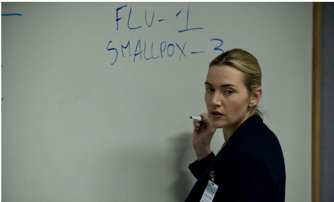
4. Tasa de reproducción.