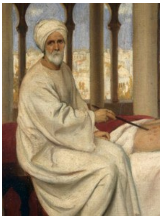
Foto 2. Retrato de Abulcasis según Ernst Board.

relacionados con la enfermedad y que son: 1) Cuentan historias únicas; 2) Cuentan historias en primera persona; 3) Aportan diferentes estrategias narrativas; 4) Ponderan el componente social de la enfermedad; 5) Proponen un papel educativo para la enfermedad; 6) Proponen la enfermedad como una oportunidad de reflexión; 7) Reconocen la limitación del lenguaje para expresar lo que se siente; 8) Proponen la narrativa como una forma de vencer las limitaciones de la expresión oral y 9) Reconocen en la narración un proceso curativo 7 (Foto 2).