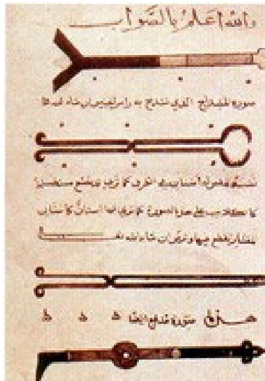
Foto 3. Al-Tasrif de Abulcasis con ilustraciones de material quirúrgico.

La amabilidad y compasión podemos verla en todos los aspectos de su vida, no solo en los médicos. Es el caso de su trato digno a todos sus trabajadores o el hecho de que nunca haga distinciones de clase o género. Dentro de su profesión, muestra rasgos de humildad al reconocer el mismo que « También un hakim ignora muchas cosas ». Como « no trabaja sólo por una remuneración que premie su larga formación y su trabajo responsable », vive de acuerdo a los valores de la profesión y enseñanza médica, que ponen al paciente por encima de cualquier cosa superficial como puede ser el rango social. Por ello, « no se cobra igual a un terrateniente que a un obrero ». Se debe cobrar a cada uno lo que pueda pagar: « yo sólo cobro las consultas o intervenciones que se hacen de intención y en pacientes pudientes », que alude al ejercicio profesional centrado en el enfermo y no en el enriquecimiento personal (Foto 3).