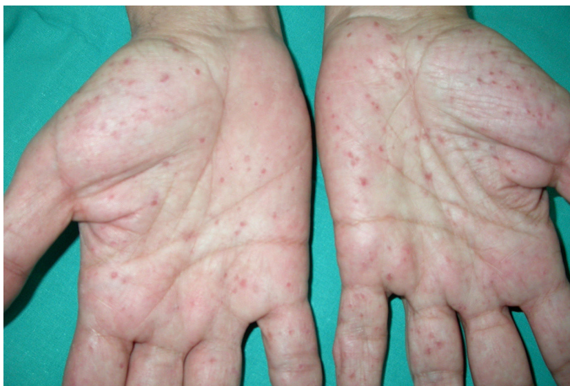
Figura 3 Pits palmares en paciente con síndrome de Gorlin.