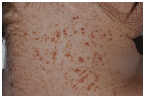
Figura 2 Múltiples carcinomas basocelulares en paciente con síndrome de Gorlin.

en el SG pueden afectar tanto a áreas fotoexpuestas como no fotoexpuestas, con un ligero predominio de las expuestas 1 . Las localizaciones más frecuentes en hombres son el tercio superior de espalda, extremidades superiores y la zona M facial, mientras que en las mujeres son el cuero cabelludo, espalda y extremidades inferiores. La proporción de cada subtipo histológico de CBC es similar al de los pacientes con CBC esporádico 29 .