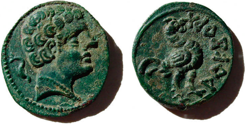
Fig. II. Semis de Arekoratas.