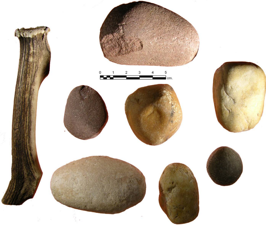
(Fig. 1). Algunos de las opciones de percutores que los participantes podían elegir.