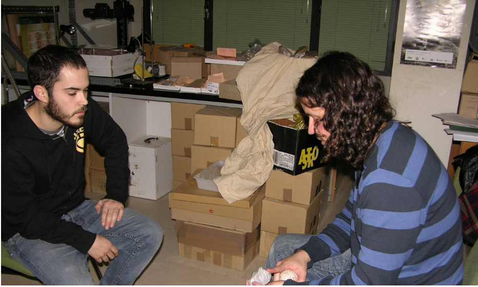
(Fig.7) Última fase de enseñanza donde se les impartían lecciones verbalizadas y prácticas.