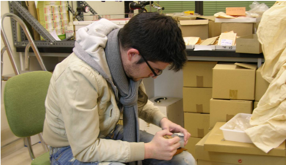
(Fig.4) Tallador inexperto con defectos visibles en su forma de agarrar el percutor y colocar el núcleo.