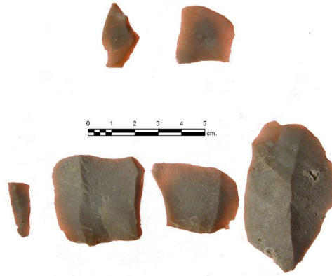
(Fig.3). Productos informes de talladores en la primera fase de la experimentación y productos obtenidos en la última fase de la experimentación. Parte superior y parte inferior de la fotografía respectivamente.