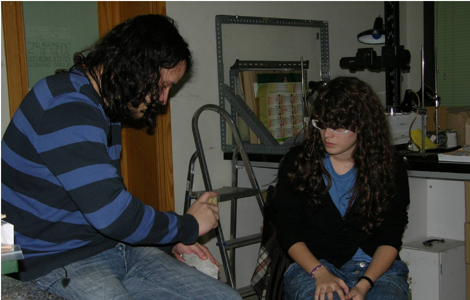
(Fig. 8) Explicación Teórico-práctica sobre errores cometidos en las anteriores fases de la experimentación.