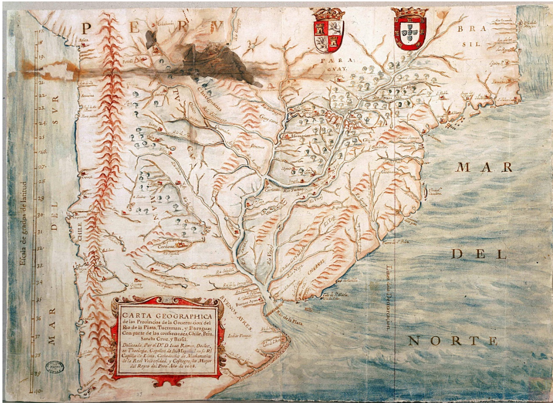
AGI.: MP-Buenos_Aires, 29. Año 1683.