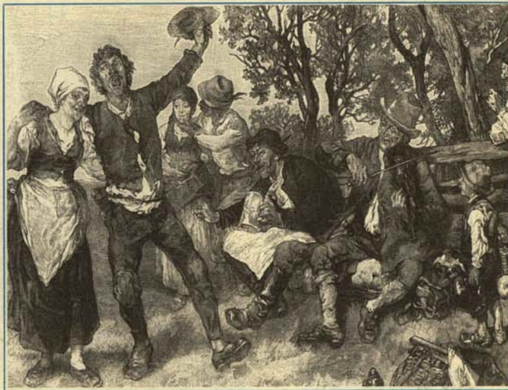
—¡Por fin han visto lo que vale el campo!