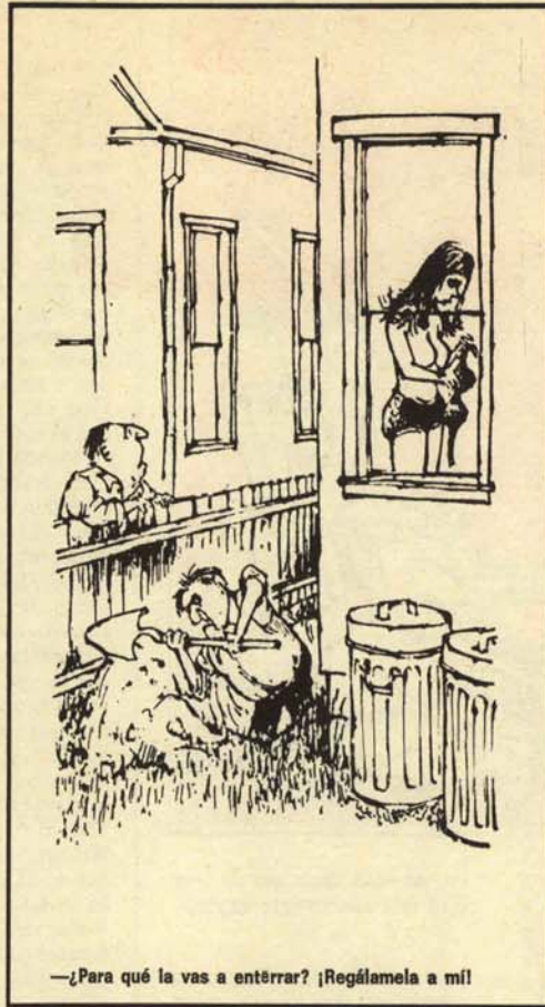
—¿Para qué la vas a enterrar? ¡Regálame la a mí!

Pero el tío venga de rollo tártaro con el secano, el maíz híbrido y las naranjas, que dice que no las quieren en el Mercado Común. «Pues lléveselas usted al mercado de Barceló, a ver si allí se las quieren», le decía yo por ir matando la noche. Y que te vengas conmigo al campo, Maripi, que estoy muy solo y aquello es muy triste y en el pueblo ya no quedan mozas, que están en Alemania haciendo penicilina. Pues, es lo que me faltaba a mí, a estas alturas, con lo corrida que yo estoy, meterme de moza de cántaro con un feudal de éstos. Total, que me dió la noche, el latifundista, y al final vomitaba el amontillado en las escupideras. Quería llevarme a casa en el tractor, por la Gran Vía. De cine. ■ UMBRAL.