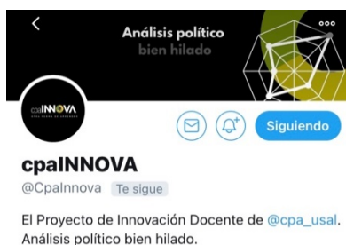
Imagen 3: @CpaInnova

3º. La creación de hilos de Twitter. Estos hilos tenían como características innovadora poder sintetizar la información obtenida a partir de los blogs creados en el punto 1. El proyecto creó una cuenta en Twitter para la difusión para cumplir con este objetivo. A partir de ella se difundirían los contenidos de las mejores prácticas llevadas a cabo a través de los blogs desarrollados por los estudiantes en las diferentes materias. La cuenta se denominó @CpaInnova (Ver Imagen 3) con un hijo fijo explicando el proyecto (ver Imagen 4):