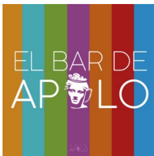
Imagen 1: Bar de Apolo. @ElBardeApolo · Sitio web de sociedad y cultura.

Representa una plataforma ya existente, y creada por miembros del equipo académico de este proyecto en la red facebook para difundir, reflexionar y analizar diferentes temas desde un punto de vista científico.