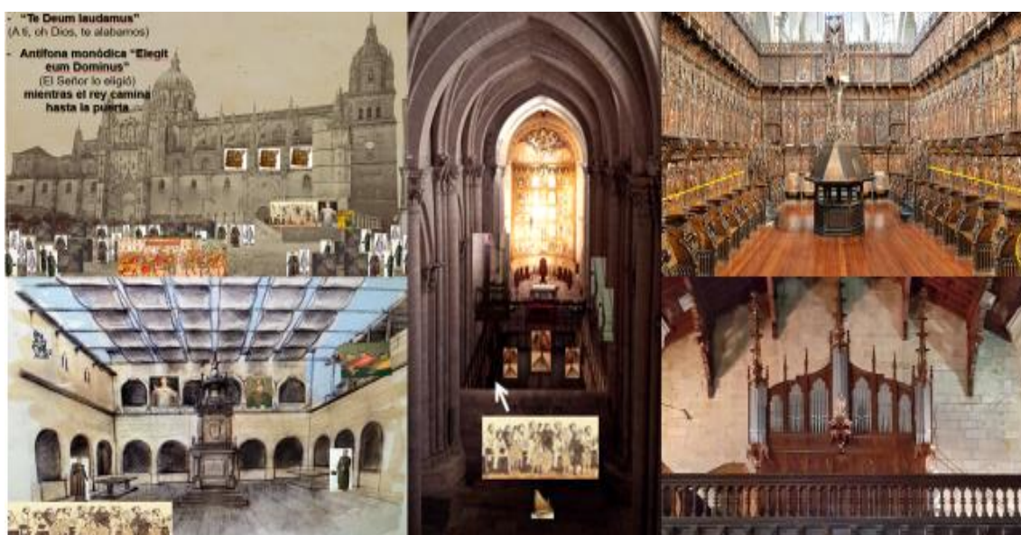
Figura 2. Ejemplos de imágenes y materiales elaborados o presentados por el profesor y los alumnos en la asignatura de Expresión Musical en Educación Primaria

En el segundo bloque de la asignatura de música se presta atención a las posibilidades que ofrecen los edificios histórico-artísticos para estudiar algunas cuestiones musicales que pueden ser trasladadas a los alumnos de Primaria. Para ello, con la ayuda del profesor, se propone un análisis de los espacios musicales antiguos, más comunes y conocidos, de tipo religioso, tales como los coros o las tribunas, pero también de otros profanos, tales como palacios o plazas, dentro del grupo de edificios analizados en el primer bloque (ver Figura 2). En base a ellos, se planteó un comentario sobre los instrumentos, músicos y otros elementos que protagonizaban esas interpretaciones, añadiendo la ubicación de tales protagonistas, el tipo de música y público o la recepción de estas experiencias. Finalmente, se proyecta una exposición de lo trabajado a través de una presentación, podcast, cuento musicalizado, cómic, etc. que pueda quedar como material didáctico de futuro, dentro de esa necesidad de seguir indagando en las posibilidades que ofrece el patrimonio artístico y musical como recurso didáctico, y de diseñar materiales al respecto.