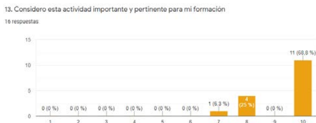
Imagen 2. Resultado de lo escrutado en la consideración de esa formación de Recursos gramaticales y ortotipográficos y Búsquedas bibliográficas y edición de textos académicos. Asignatura: Museología. 3º Grado en Historia del Arte

En todos los casos, los alumnos y las alumnas han mostrado su satisfacción al 62,5% por la claridad de las explicaciones y por la atención y la dedicación recibida por parte del profesorado implicado en estas sesiones. Derivado de esto, el 60% de ellos se sintió satisfecho con la asistencia a estas clases. Con la idea de mejorar en el curso académico 2020-2021, estos estudiantes han considerado adecuado que en el futuro se aborde la formación en la elaboración y en el diseño de trabajos académicos y la consulta de bases de datos, en un porcentaje del 68,8%. Por último, el 56,3 % de los encuestados considera que el contenido de las sesiones debe formar parte del plan de estudios de Historia del Arte (Imagen 2 y 3).